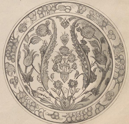
10. Rhodische Fayence-Schüssel. XVII. Jahrh. Germ. Museum.

Bemerkung. Die Buchstaben in den Klammern neben den Unterschriften beziehen sich auf die Provenienz der Holzschritte. Das Nähere s. Boge. 149.