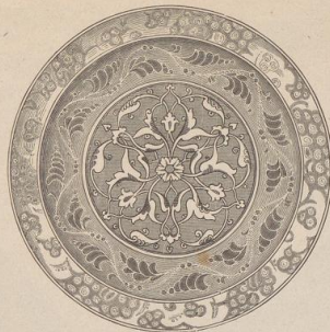
6. Persische Fayence-Schüssel. XVII. Jahrh. Germ. Museum.