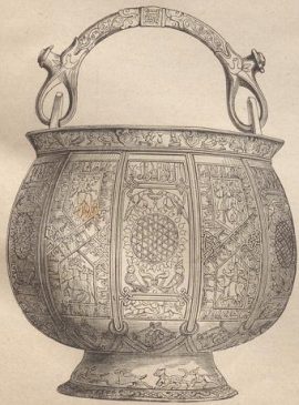
4. Ambischer Bronze-Eimer. XIII. Jahrh. (G. B.)