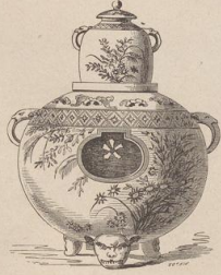
2. Japanisches Sazuma-Fayence-Gefäß. (G. B.)

Zu vergleichen Bilderbogen No. 46, 47 und 48.