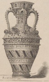
8. Vergoldete Thon-Vase aus Valencia. (J.)