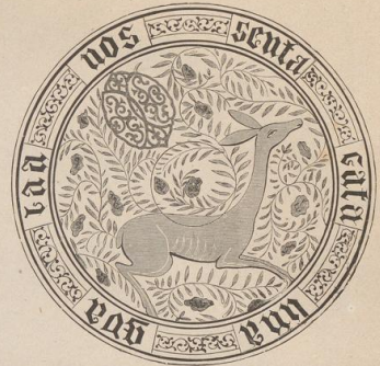
9. Spanisch-maurische Fayence-Schüssel. (G. B.)

Zu vergleichen Bilderbogen No. 46, 47 und 48.