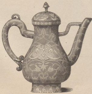
3. Indisches Nephritgefäß. (Z.)