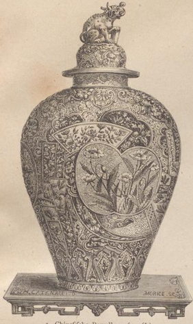
1. Chinesische Porzellanvase. (J.)