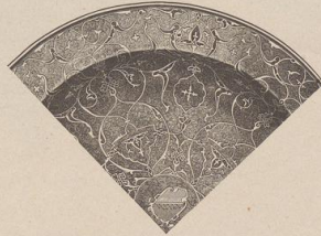
7. Silbertaufchirte Messingchüssel, persisch. (Z.)