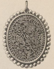
4. Indischer Schmuck. (Z.)