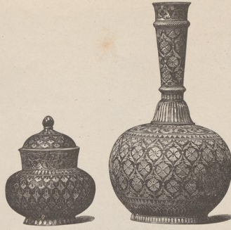
2. Indische Zinggefäße. Bidrah-Arbeiten. (Z.)