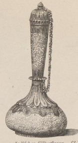
3. Indisches Silberfacon. (Z.)