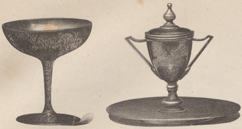
1. Indische Koofigarigefäße. (Z.)