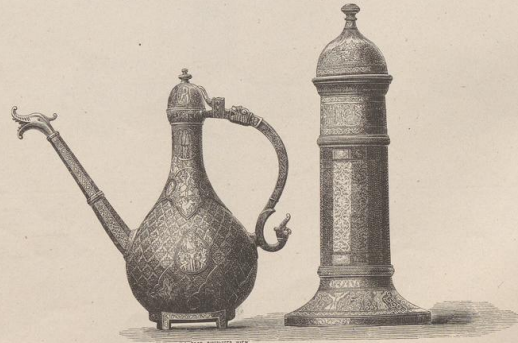
6. Gravirtes perisches Metallgeräth. (Z.)