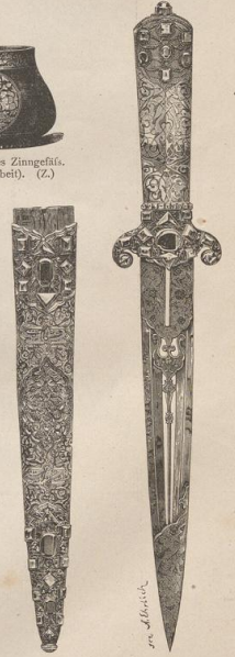
7. Perisch-indischer Dolch nebst Scheide. (Z.) Nephrit-Griff mit Gold eingelegt.