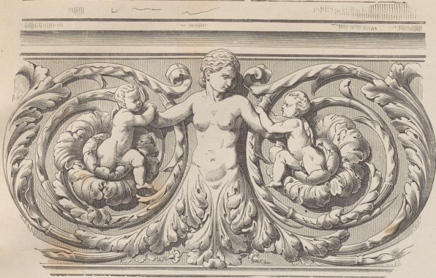
1. Marmorfries (G. H.)