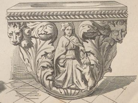
8. Brunnen (Cisterna) aus Venedig. Marmor. XIV. Jahrh. (G. H.)