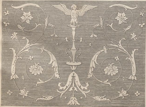
3. Holzintarsia aus Florenz. (L.)