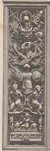
4. Pilafterfüllung am Grabmal des Gaston de Foix († 1512). Museum in Turin. Von Agostino Busti, gen. Bambaja, geb. um 1470, einem der Hauptmeister des Sculpturenschmuckes der Certosa bei Pavia. (G. B.)