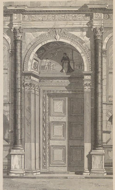
6. Portal von S. M. Novella in Florenz, von Leon Battista Alberti. Vergl. Bogen 97 Fig. 10. (D.)

Druck von Metzger & Wittig in Leipzig. — s. Abdruck 187.