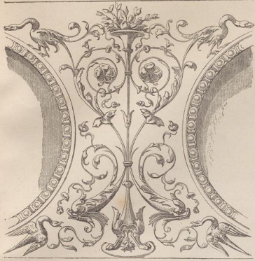
1. Ornament aus S. M. della Pace zu Rom. Von Bramante (1444-1514). (D.)