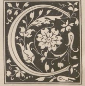
6. Aus einem Venetianischen Druck von 1496. (O. M.)