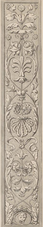
3. Pilafterfüllungen. S. Maria dei Miracoli in Venedig.