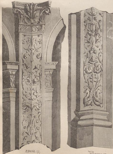
4. Pilafterornament von Bramante in S. Satiro zu Mailand. (D.)