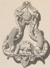
2. Thürklopfer aus Bologna. Ende des XVI. Jahrh. (G. H.)