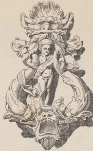
3. Thürklopfer. Ende des XVI. Jahrh. Oesterr. Museum. (G. H.)