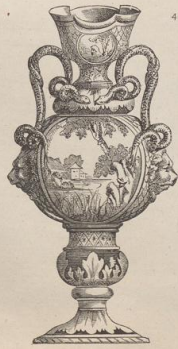
11. Fayence-Vase im Stil italienischer Majoliken. Fabrik von Nevers. (G. B.)