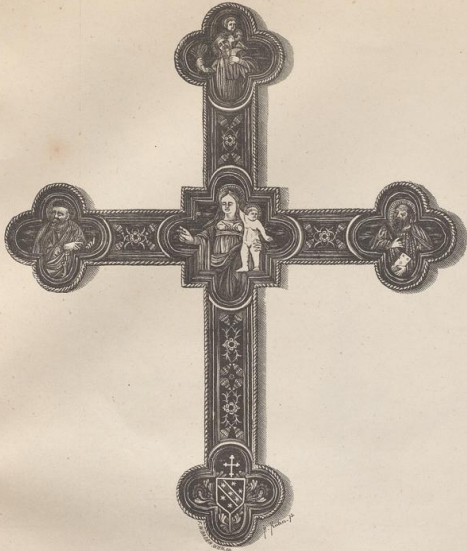
1. Emailirtes Kreuz. XV. Jahrh. (Ö. M.)