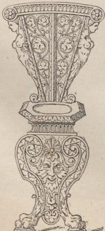
7 u. 8. Florentinische Stühle. XVI. Jahrh. (T.)