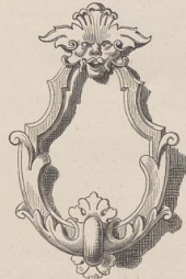
5. Thürklopfer aus Bologna. XVII. Jahrh. (G. H.)