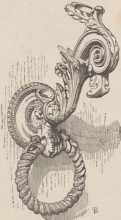
4. Fackelhalter vom Pal. del Magnifico in Siena. Um 1500. (B.)