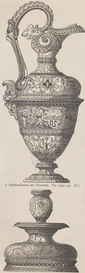
2. Majolica-Kanne mit Grottesken. Um 1530-40. (T.)