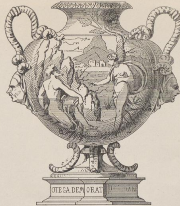
3. Majolica-Vase. Von Orazio Fontana. (Arbeit von Urbino a. 1571.) (T.)