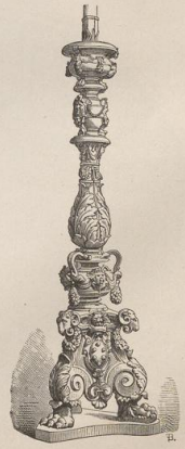
8. Venezianischer Candelaber in Bronze. (B.)

Druck von Metzger & Wittig in Leipzig. — 2. Abdruck 1879.