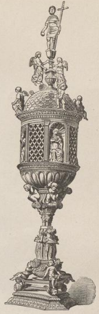
7. Bronze-Ciborium in der Kirche Fontegiusta zu Siena. (B.)