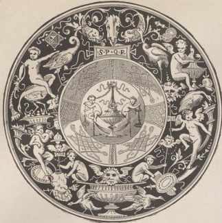
1. Majolicteller von Caffagiolo. (G. B.)