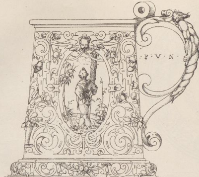
2. Kanne von Paul Vllodi. († Ende des 15. Jahrh. in Nürnberg.)