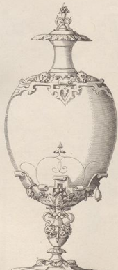
5. Becher von Virgil Solis.