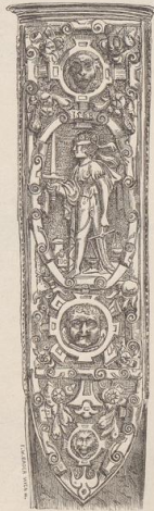
10. Ornament von einem Stadtrichterlehrent, datirt 1568. Museum in Linz. (W. W.)