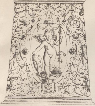
1. Kanne nach einem Stich von Johann Sibmacher. († 1612 in Nürnberg.)