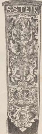
11. Ornament vom Functionär der Stadt Steyr. (W. W.)