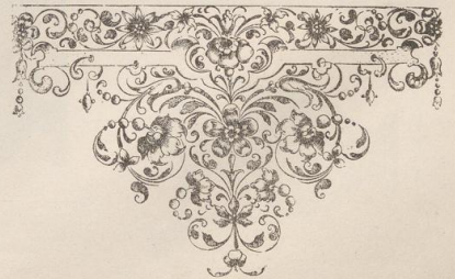
6. Ornament von Hieronymus Baug, Kupferstecher in Nürnberg.

Druck von Metzger & Wittig in Leipzig. — 3. Abdruck 188a.