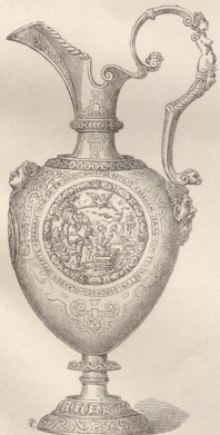
8. Kanne aus vergoldetem Silber, im Besitz des Grafen H. Herberstein-Eggenberg, Nürnberger Arbeit. 16. Jahrh. (W. W.)