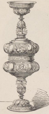
5. Doppelbecher. Ende des 16. Jahrh. Regensburger Silberfund. (Vergl. Taf. 169, Fig. 1 u. 2.)