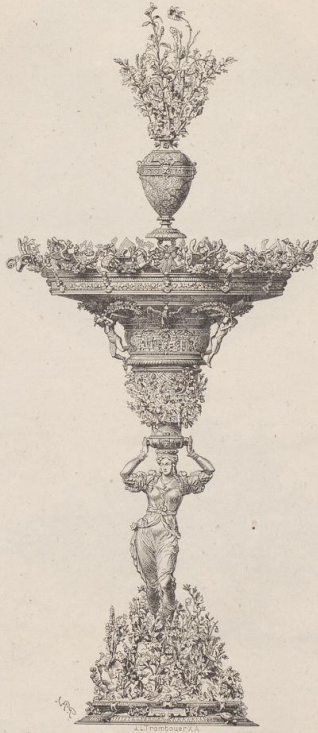
2. Der Merkel'sche Tafelaufsatz in Nürnberg. Von Wenzel Jamnitzer. (Z.)