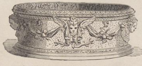
6. Fayence-Gefäßs von Bernhard Palissy. (Vergl. Taf. 169, Fig. 6.) (G. B.)