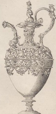
3. Silberne Kanne von W. Jamnitzer.