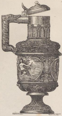
8. Krug von B. Palissy. (Vergl. Taf. 169, Fig. 6.) (G. B.)