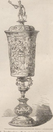
6. Zunftbecher. Ende des 16. Jahrh. Regensburger Silberfund. (Vergl. Taf. 169, Fig. 1 u. 2.)