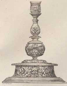
7. Bronzeleuchter. (Französisch) 16. Jahrh. (G. B.)