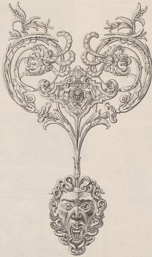
3. Ornament von einer Rüstung im historischen Museum zu Dresden. 16. Jahrh. (Z.)