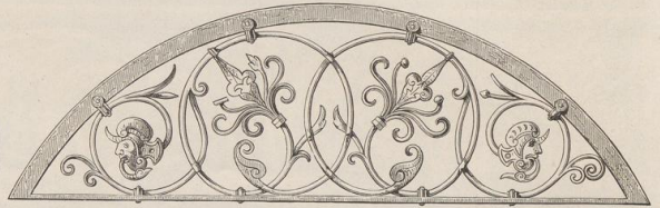
6. Oberlichtgitter. Villa Bergau in Nürnberg. 16. Jahrh. (G. H.)