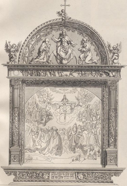
1. Gefchnitzter Rahmen (Altarauffatz) von Dürer. 1508. Germanisches Museum. (Thausing.)