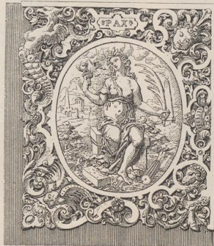
8. Eckbechlag von dem Einbände Fig. 7.