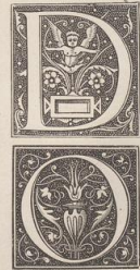
10 u. 11. Initiale aus franzöf. Drucken von 1526-40. (Ö. M.)