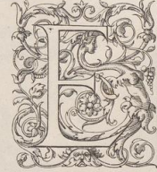
9. Initial von Geoffroy Tory.