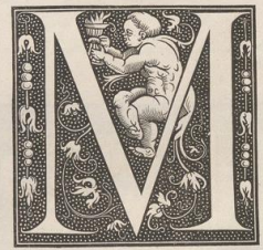
13. Aus einem Mainzer Druck. 16. Jahrh. (Ö. M.)