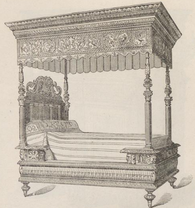
6. Bettstelle. Deutsche Arbeit. 16. Jahrhundert. (W.)