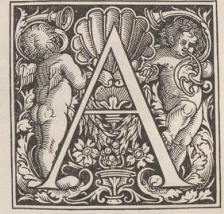
8. Initial von Albrecht Dürer. (Ö. M.)