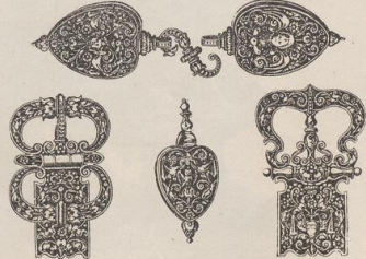
12. Ornamente von Theodor de Bry. (Geb. 1561 in Lüttich, † 1623 in Frankfurt.)