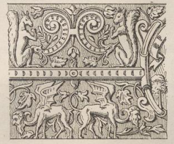
7. Fries von einem Niederrhein. Steinzeugkrüge. (Vergl. Taf. 169, Fig. 11.) (T.)