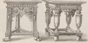
4. Möbelzeichnungen von Jan Vredeman de Vries. (Geb. 1527 zu Leeuwarden, † 1604 in Antwerpen.)