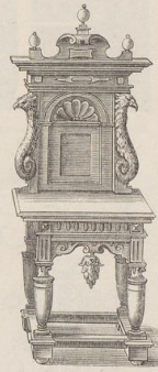
5. Möbelzeichnung von Jan Vredemann de Vries.