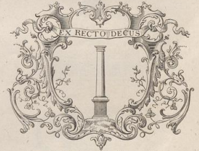
6. Vignette nach Papillon. (Z.)