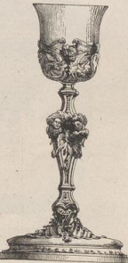
9. Altarkelch von Pierre Germain. (L.a.)