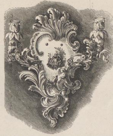
3. Wandleuchter aus Meissener Porzellan. (Z.)