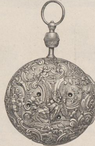
7. Französisches Tischenuhrgehäuse. (L.a.)