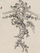
5. Stuckornament aus dem Kurfürstlichen Palais in Dresden. (Z.)