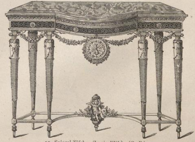
10. Spiegel-Tisch. (Louis XVI.) (G. B.)

Druck von Metzger & Wittig in Leipzig. — 3. Abdruck 1880.