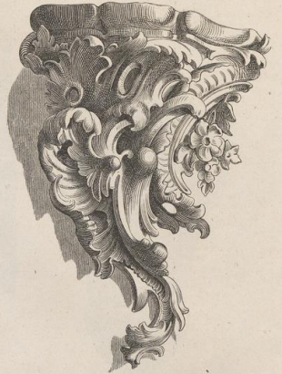
4. Gefchnitzte Konsole. (G. H.)