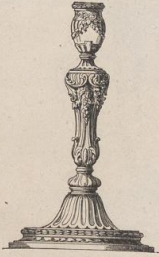
8. Leuchter von Pierre Germain. (Louis XV.) (L.a.)