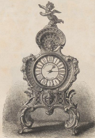
4. Standuhr aus Porzellan. Französisch. (L.a.)