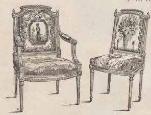
13 u. 14. Stühle. Zweite Hälfte des 18. Jahrh. (L.a.)