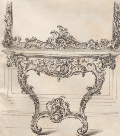
2. Spiegeltisch aus dem Kurländischen Palais zu Dresden. (Z.)