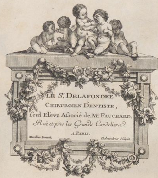
15. Adreß-Karte eines Zahnarztes. Um 1760. (L.a.)