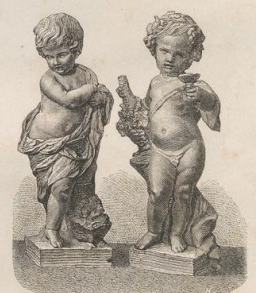
3. Biscuit-Figürchen von Clodion. Sèvres. (L.a.)