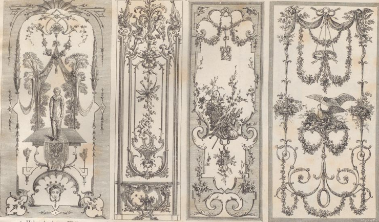
5. Holzmaleri von Watteau. Anfang des 18. Jahrh. 6. Holzschnitzerei nach Cavillès. Mitte des 18. Jahrh. 7. Holzmaleri von Ranfon. 1. Hälfte des 18. Jahrh. 8. Holzmaleri von Van Spaendonk. 2. Hälfte des 18. Jahrh. 5-8. Wandverkleidungen aus dem 18. Jahrh. Französische Arbeit.