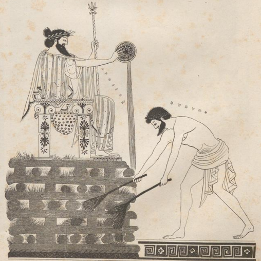
7. Crocus auf dem Scheiterhaufen. Rothfiguriges Vasenbild der voralexandrinischen Zeit.

Druck von Metzger & Wittig in Leipzig. — 3. Abdruck 1882.