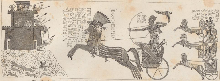
1. König Rameses II. mit seinen Söhnen erobert eine Bergfestung. Kammer des Grottenbaues bei Abufimbel in Egypten. Halberhohene bemalte Darstellung aus der Zeit der 19. Dynastie.