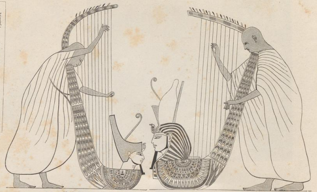
3 u. 4. Harfenpieler. Malerei in den Grotten von Beni-Haïfan. Aus der Zeit der 6. Dynastie.