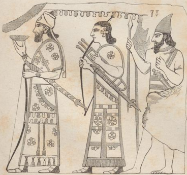
5. Fragment eines attischen Ziegelgemäldes.

Zur Geschichte der griechischen Vasenmalerei vergl. nach Tafel 30, Fig. 3, 4, 5, 6, 7, 8 und 9.