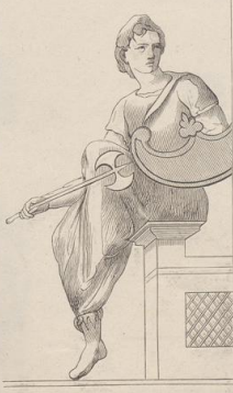
5. Sitzende Amazone. Von einem Wandgemälde zu Pompeji.