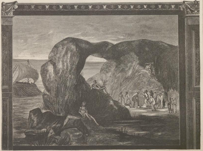
4. Odysee Landschaft. Unterweltbild. Wandgemälde vom Esquillin zu Rom.