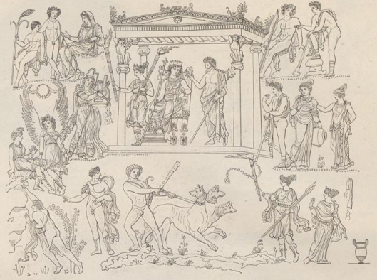
2. Unterwelt-Scene. Unteritalisches Vasengemälde.