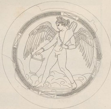
1. Griechischer gravirter Spiegel von der Insel Kreta.