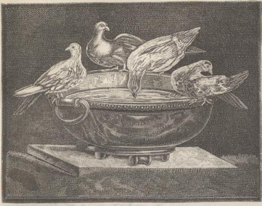
3. Capitolinisches Taubenfontain. Rom.