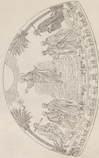
6. Mosaik aus S. Cosma e Damiano in Rom.