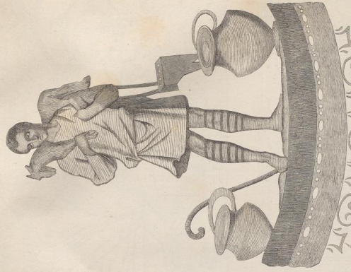
2. Der gute Hirte, Comacinerium S. Agnate bei Rom.