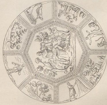
4. Deckenmalerei aus den Katakomben.