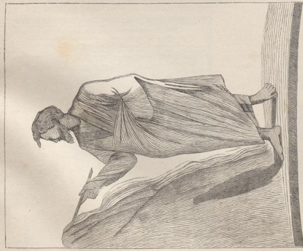
1. Mose, Comacinerium S. Agnate bei Rom.