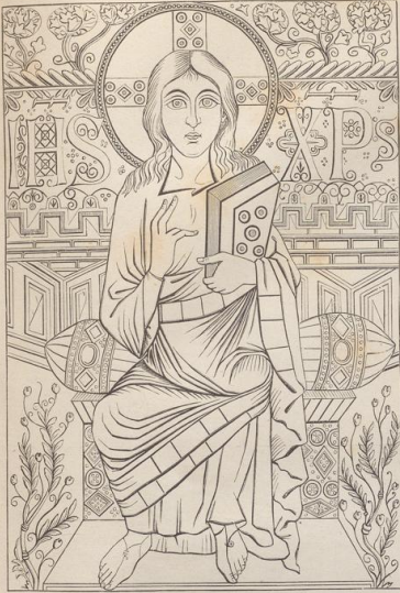
1. Christus. Aus dem Evangeliarium Karl's des Großen (781). Paris.