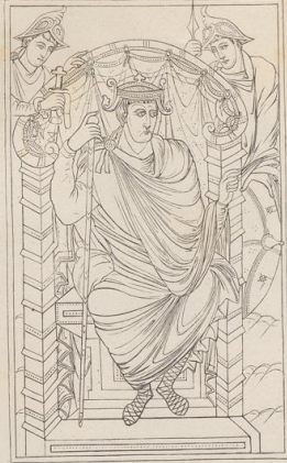
2. Kaiser Lothar. Aus dem Evangeliarium in Paris. 9. Jahrh.