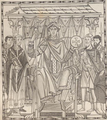
3. Kaiser Otto III. Aus dem Evangeliarium in München. 11. Jahrh.