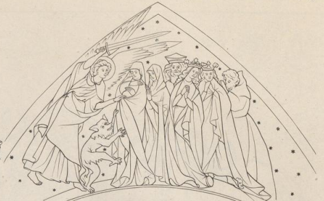
7. Aus der Kapelle zu Ramersdorf bei Bonn. Anfang des 14. Jahrh.