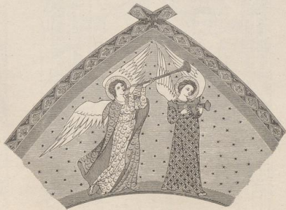
6. Aus der Kapelle zu Ramersdorf bei Bonn. Anfang des 14. Jahrh.