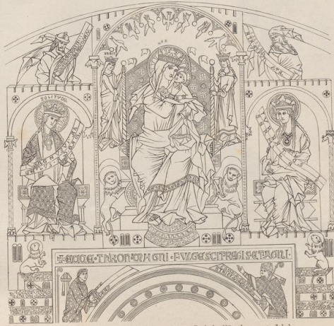
6. Von den Wandmalereien im Dome zu Gork in Kärnten. 13. Jahrh. Druck von Metzger & Wittig in Leipzig. — 3. Abdruck 1886.