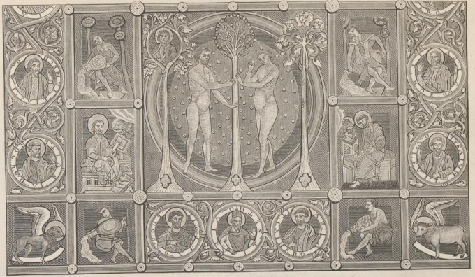
5. Von den Deckmalereien in der Michaeliskirche zu Hildesheim. 12. Jahrh.