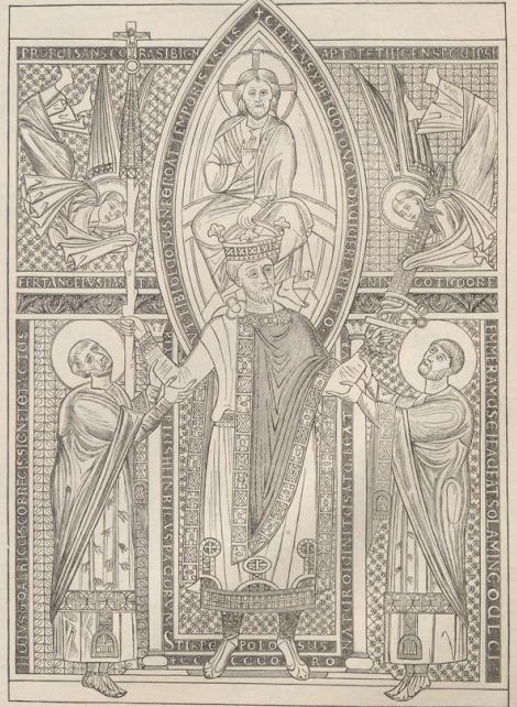
2. Heinrich II. Miniatur aus einem Missale in München. 11. Jahrh.

Druck von Metzger & Wittig in Leipzig. — 2. Abdruck 1880.