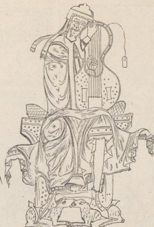
1. David. Aus dem Pfalter des Nokter Labao. Ende des 11. Jahrh. St. Gallen.