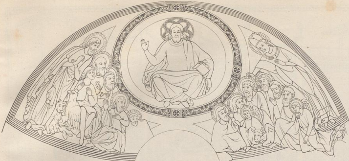
4. Von den Wandmalereien in der Kirche zu Schwarzrheindorf. Zwischen 1151 und 1157.