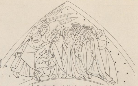
7. Aus der Kapelle zu Ramersdorf bei Bonn. Anfang des 14. Jahrh.