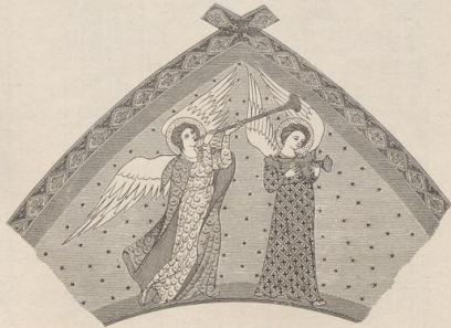
6. Aus der Kapelle zu Ramersdorf bei Bonn. Anfang des 14. Jahrh.