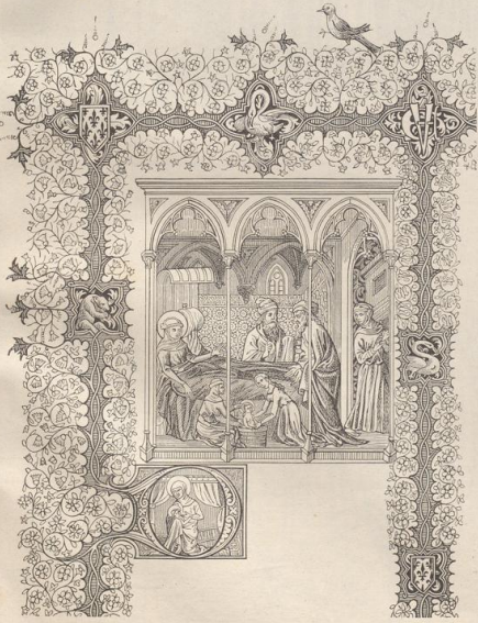
3. Aus dem Pfalter der Herzogin von Berry. Mitte des 14. Jahrh. Nationalbibliothek in Paris.