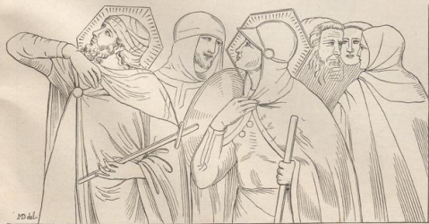
4. Aus der Kreuzigung des Ambr. Lorenzetti in San Francesco zu Siena. Vergl. Taf. 197, Fig. 1.