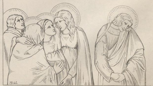
5. Aus der Kreuzigung des Ambr. Lorenzetti in San Francesco zu Siena. Vergl. Taf. 197, Fig. 1.