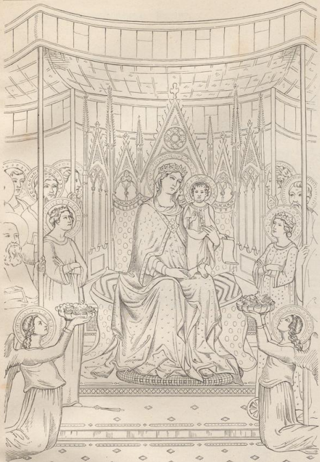
1. Aus der 'Maestà' des Simone Martini (1281-1344) im Palazzo pubblico zu Siena. 1315.