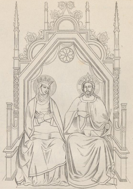
3. Aus dem Paradies des Orcagna (1308 (?) bis nach 1368) in Sta. Maria novella zu Florenz.