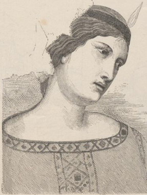
6. Kopf der Concordia in der Abbildung No. 1 auf Taf. 197 von Ambr. Lorenzetti. Druck von Metzger & Wittig in Leipzig. - 3. Abdruck 1886.