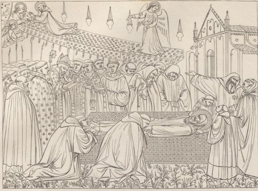
4. Beihaltung des heiligen Benedict. Wandgemälde von Spinello Aretino (1333-1410) in S. Miniato bei Florenz.