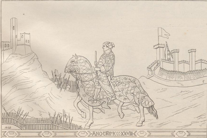
2. Guidoricci Fogliani de' Ricci. Wandgemälde des Simone Martini im Palazzo pubblico zu Siena. (1328.) Vergl. Taf. 196, Fig. 2.