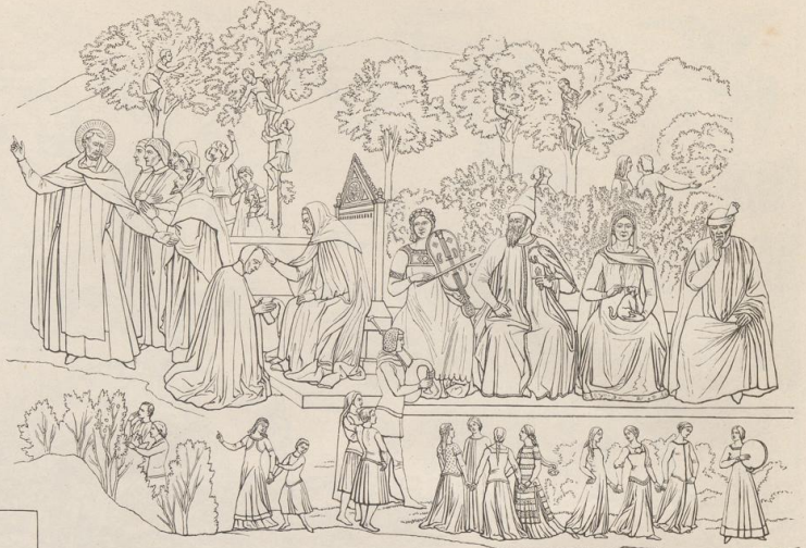
3. Bruchstück aus dem dem Simone Memmi zugeschriebenen Wandgemälde der Spanischen Kapelle in S. M. novella zu Florenz.