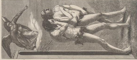
3. Die Vertreibung aus dem Paradies. Von Masaccio. Kapelle der Brancacci.