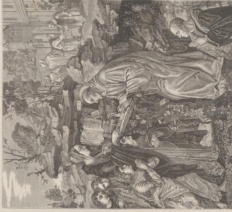
2. Die Vision des h. Bernhard. Von Filippo Lippi. Basilika in Florenz.