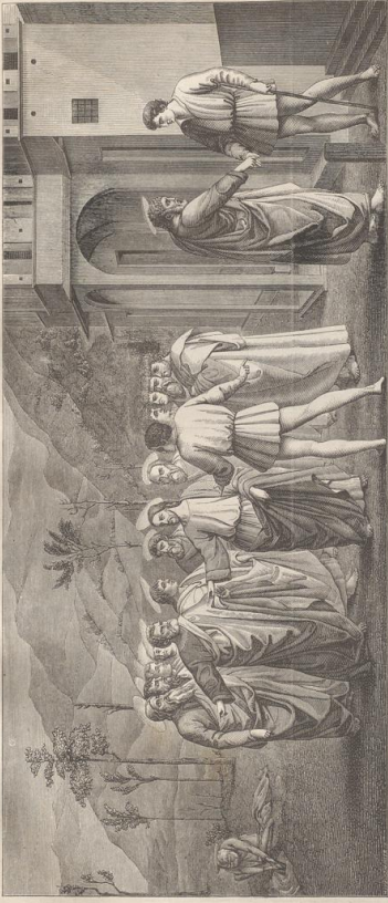
1. Der Zug ins Gefängnis. Wandgemälde von Masaccio (geb. 1404, † wahrscheinlich 1448). Kapelle der Brancacci im Carmine zu Florenz.