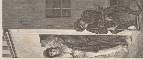
4. Die Befreiung Petri. Von Filippo Lippi. Kapelle der Brancacci.