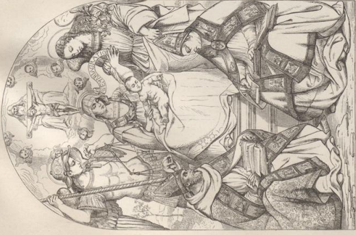
1. Abbildung von Luca Signorelli. Akademie in Florenz. Vergl. Jhr. 322, Fig. 3.