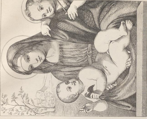
2. Madonna. Originalmalerei von Francesco Francia. (Um 1450-1517). Dresden, Gallery.