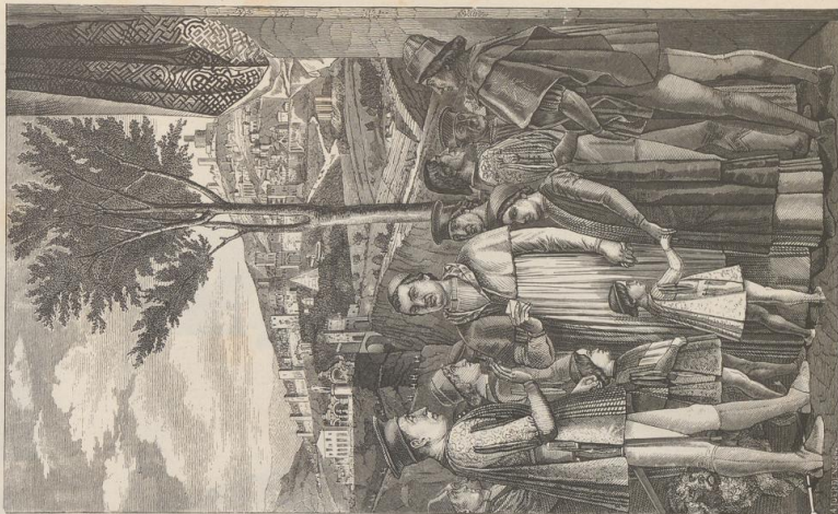
2. Beginnung des Marktes der Lantovis von Mantua mit feierl. Schluß dem Kardinal Francesco Gonzaga. Fresco von Mantegna. Cattedra di Geogr. zu Mantua.

Druck von Metzger & Wittig in Leipzig. — 5. Abdruck 1868.