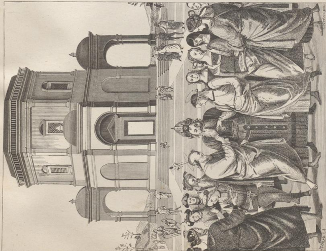
3. Die Vermählung Maria's. Ölgemälde von Pietro Perugino. Museum zu Cambrai.