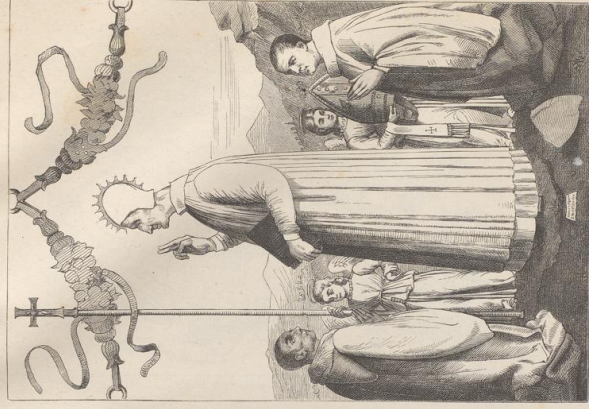
1. Der heil. Lorenzo Gühinhilf. Temperamalde von Gentile Bellini (1421—1492). Akademie in Florenz.