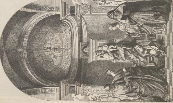
2. Sana Conversatione. Originalmalde von Giovanni Bellini (1426—1516). S. Zaccaria, Venedig.