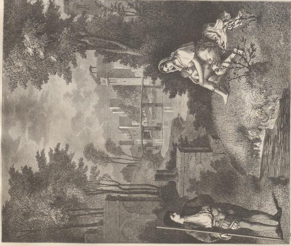
120. Jhrt. gr. 3. Sog. Famille des Giotto. Originalmalde von Giotto. Gallerie Giovanni di Firenze.