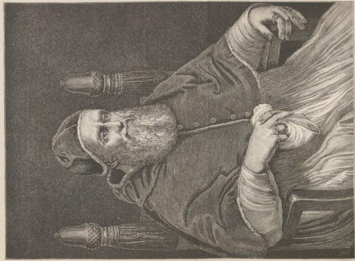
3. Bildnis Julius' II. Galerie der Uffizien.