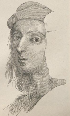
5. Raffael's Selbstbildnis aus der 'Schule von Athen'.