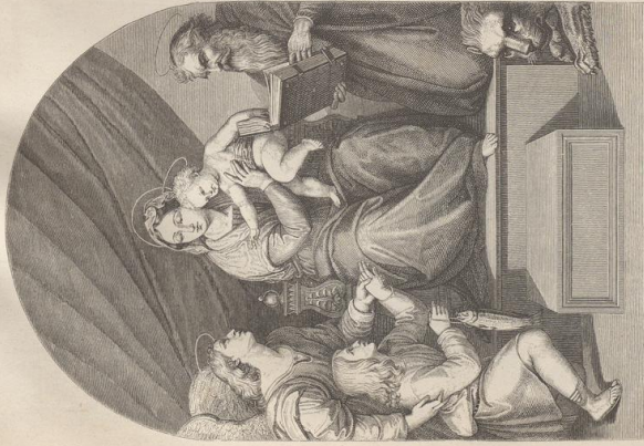
4. Die Madonna mit dem Kinde, Miriam del Prato in Madrad.