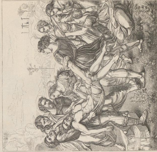
2. Die Gableung, Galerie Borghese in Rom.