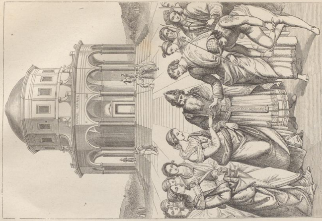
1. Die Vermählung Maria's (Spöhlitz), Brera in Mailand.

Raffael, Santi, geb. 1483 in Urbino, † in Rom 1520.