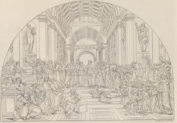
2. Die Schule von Athen. Wandgemälde in den Stanzen des Vaticanus. Rom.