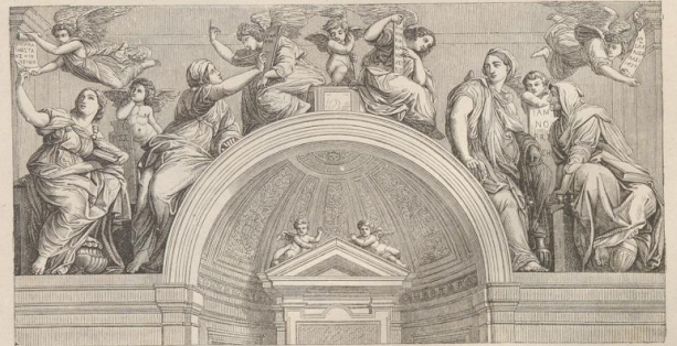
4. Die Sibyllen. Wandgemälde in Sta. Maria della Pace. Rom.

Druck von Metzger & Wittig in Leipzig. — 3. Abdruck 1880.