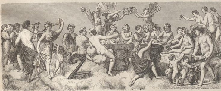
3. Die Hochzeit der Psyche. Deckengemälde in der Villa Farnesina zu Rom.