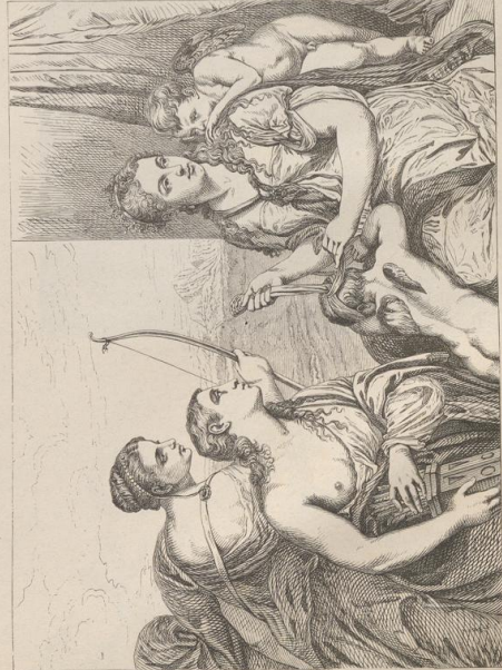
3. Die Ausrottung Amors. Von Tizian. Pal. Doghetae in Rom.