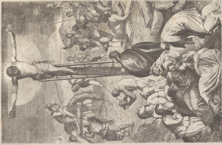
4. Mittelszene der Kreuzigung. Von Jacopo Robusti genannt Tintoretto (1518—1594). Venedig. Scuola di S. Rocco.