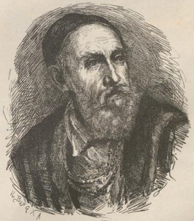
8. Tiziano Vecellio (1477—1576).

Druck von Metzger & Wittig in Leipzig. — 5. Abdruck 1886.