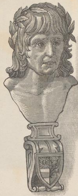
2. Büste des Andrea Mantegna (1431—1506).