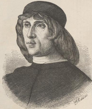
7. Giovanni Bellini (1426—1516).