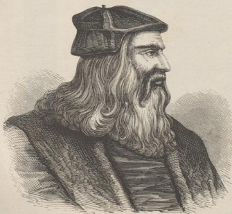
6. Lionardo da Vinci (1452—1519).