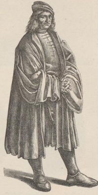
3. Selbstporträt des Luca Signorelli (1441—1523).