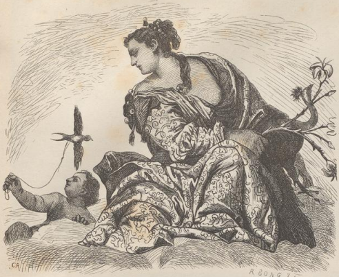
1. Von den Fresken des Paolo Veronese in der Villa Maifr.