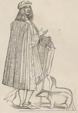
4. Selbstporträt des Giovanni Antonio Bazzi, gen. il Sodoma (1477—1549). Mont' Oliveto bei Siena.