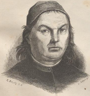
5. Pietro Vannucci, gen. Perugino (1446—1524).