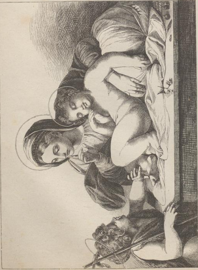
2. Maria mit dem schlafenden Christkinde. (Le silveo) Von Annibale Carracci (1560—1609), Paris, Louvre.