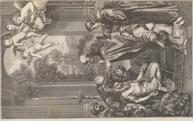
3. Die letzte Communion des h. Hieronymus. Von Domenico Zampieri gen. Domenichino (1581—1644), Rom, Vatican.