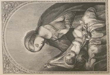
7. Madonna. Von Carlo Dolce (1686).

Von der von Ludovico Carracci gezeichneten Madonnen-Gruppe, die im Jahre 1600 in Rom durch den Maler des Namens der Akademiker, Sohn, werden die Carracci und ihre Schüler, im Gegenstand zu dem Naturalisten, auch als Bildhauer beibehalten.