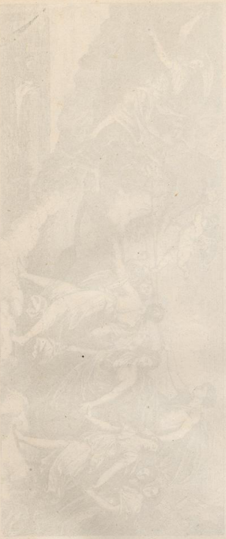
Die Fischer von Samobor, ein Bild aus dem Jahre 1811.