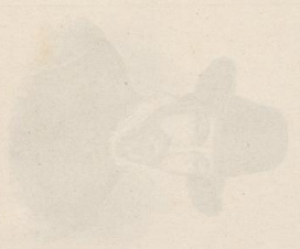
Die Fischer von Samobor, ein Bild aus dem Jahre 1811.