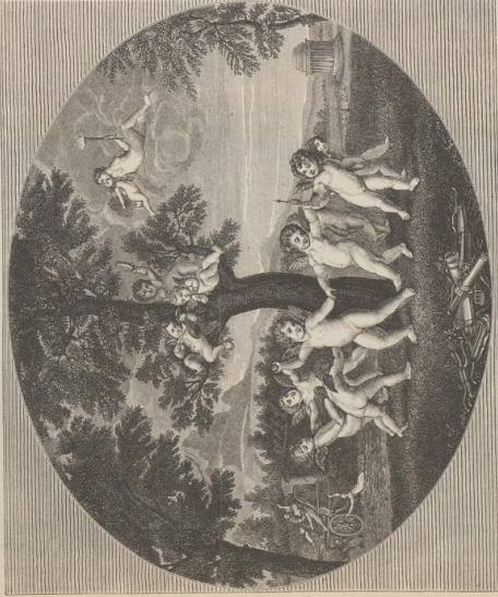
6. Americanenztanz. Von Francesco Albani (1578—1660), Mailand, Sammlung der Brera.

Von der von Ludovico Carracci gezeichneten Madonnen-Gruppe, die im Jahre 1600 in Rom durch den Maler des Namens der Akademiker, Sohn, werden die Carracci und ihre Schüler, im Gegenstand zu dem Naturalisten, auch als Bildhauer beibehalten.