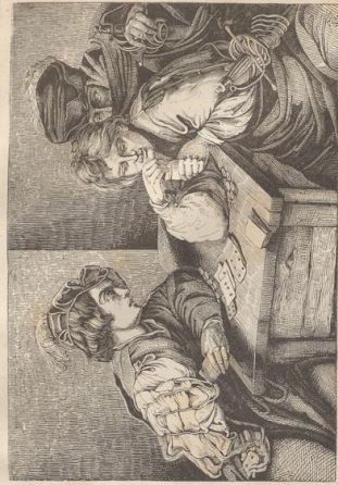
2. Einfache Spieler. Von Michelangelo da Caravaggio. Dresdener Gallerie.