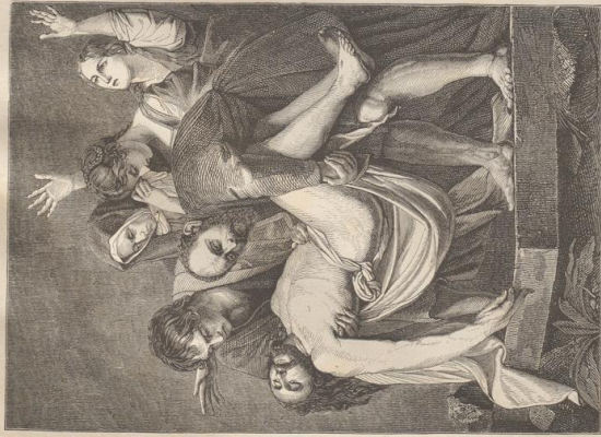
f. Grablegung Christi. Von Michelangelo Ananigi da Caravaggio (1569-1639). Rom, Vatikan.