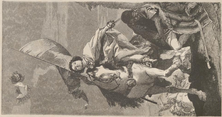
4. Der heil. Jacobus. Von Giovanni Battista Tiepolo (1697-1768). S. Eufachio in Venedig.