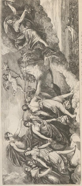
4. Aufrich. Von Guido Reni (1575—1642), Deckengemälde im Casino des Palazzo Ruspoli in Rom.

Druck von Metzger & Wittig in Leipzig — 3. Abdruck 1888.