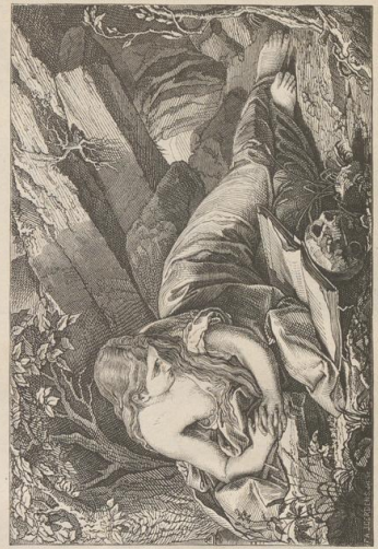
5. Blühende Magdalenen. Von Pompeo Batoni (1704-1787). Dresdener Gallerie.