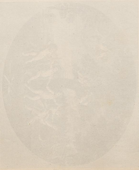
Die Fischer von Samobor, ein Bild aus dem Jahre 1811.