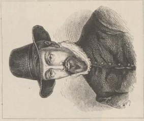
1. Ludovico Carracci (1555—1609).