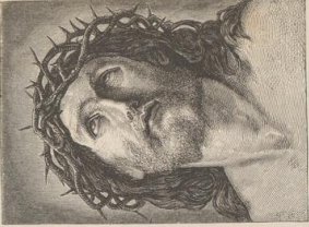
5. Ecco homo. Von Guido Reni.