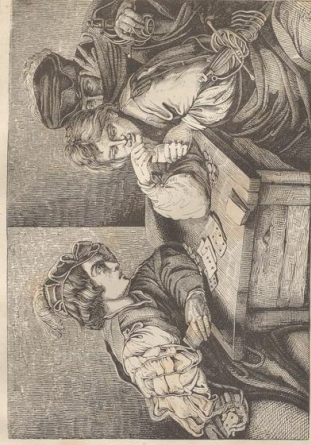
2. Einliche Spieler. Von Michelangelo da Caravaggio. Dresdener Gallerie.