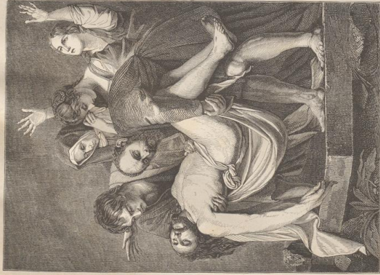
f. Grablegung Christi. Von Michelangelo Ananigi da Caravaggio (1569-1699). Rom, Vatikan.