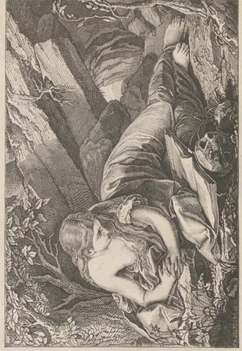
5. Blühende Magdalenen. Von Pompeo Batoni (1734-1781). Dresdener Gallerie.