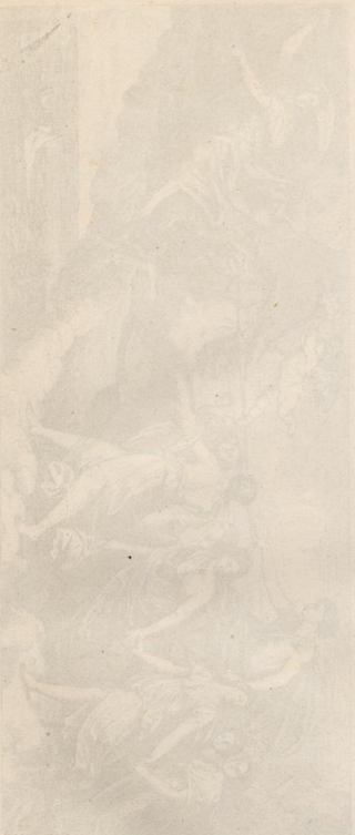
Die Fischer von Gullivar, nach dem Original von James Oglethorpe, 1726.