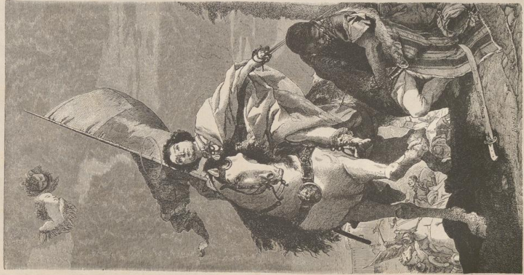
4. Der heil. Jacobus. Von Giovanni Battista Tiepolo (1697-1769). S. Eufachio in Venedig.