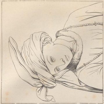
2. Bildnis des Jan van Eyck (geb. um 1390, † 1440) aus der Gruppe der gerechten Richter des Geoter Altars.