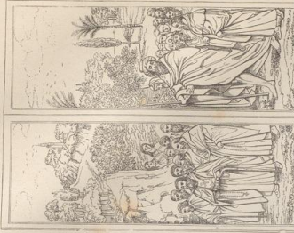
2. Der Rechte Flügelbilder der unteren Reihe. Rogier van der Weyden.