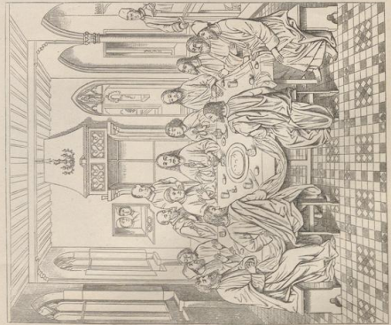
6. Das Abendmahl. Von Dierick Bouts († 1475). Lowen, St. Peter.