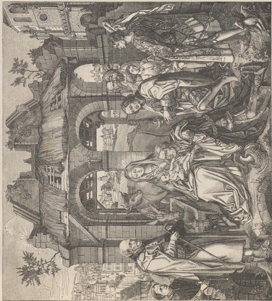
3. Abhebung der h. drei Könige. Von Roger van der Weyden (geb. um 1440, † 1464). Pinakothek in München.