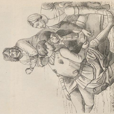
6. Gruppe aus der Kreuzigung, von Hans Memling (geb. um 1440, † 1491). Lübeck, Domkirche.