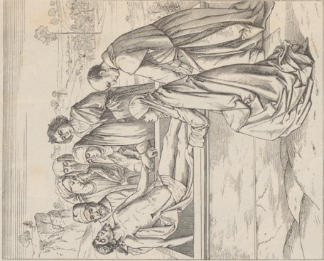
4. Grablegung Christi, von Roger van der Weyden. London, Nationalgalerie.