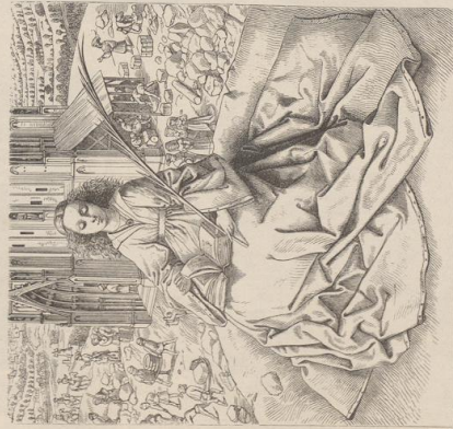
3. St. Barbara, von Jan van Eyck. Museum zu Antwerpen.