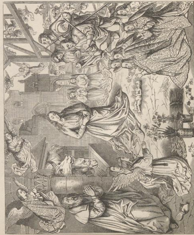
5. Die Anhebung der Hilfen. Von Hugo van der Goyen, † 1482. Sta. Maria nuova in Florenz.