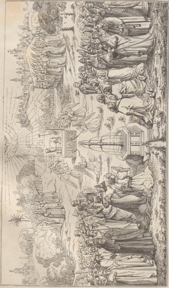
1. Der Genere Altar. Von Hubert und Jan van Eyck. Mittelbild der unteren Reihe. St. Jans zu Gent.