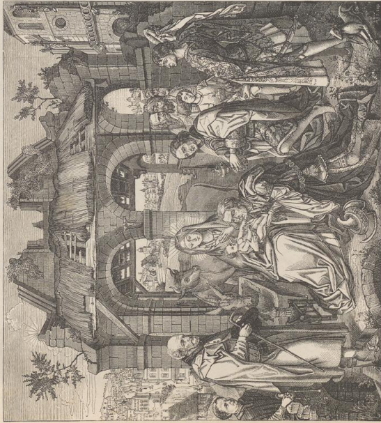
3. Abhebung der h. drei Könige. Von Roger van der Weyden (geb. um 1400, † 1464). Pinakothek in München.