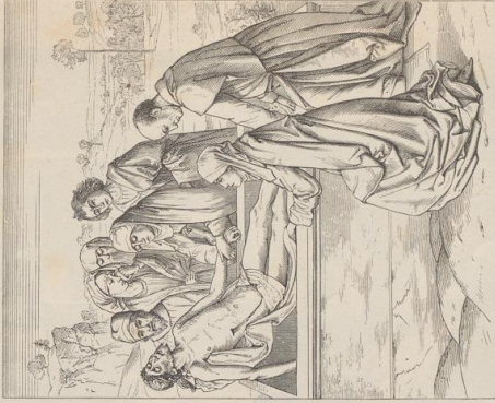
4. Gnabiegung Christi, von Roger van der Weyden. London, Nationalgalerie.