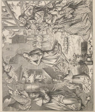
5. Die Anbetung der Hirten. Von Hugo van der Goyen, † 1482. Sta. Maria nuova in Florenz.