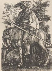
7. Ein Landsknecht. Kupferlich von B. Beham.