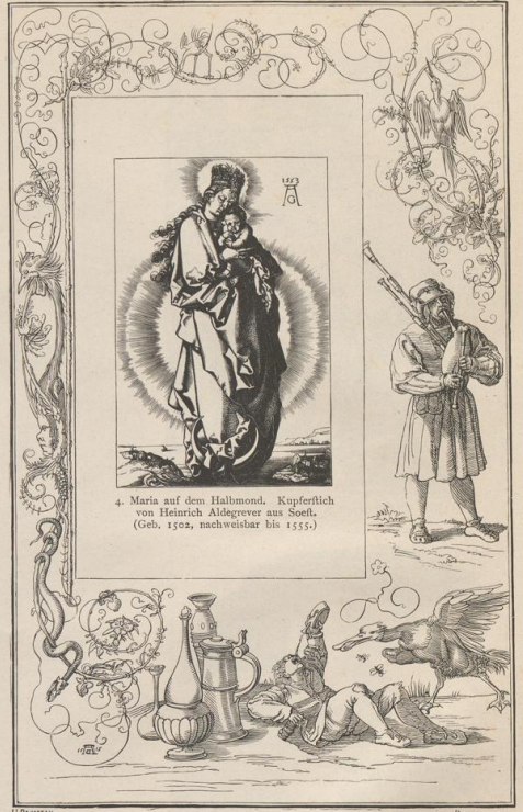
4. Maria auf dem Halmmond. Kupferlich von Heinrich Aldegrever aus Soeth. (Geb. 1502, nachweisbar bis 1555.)