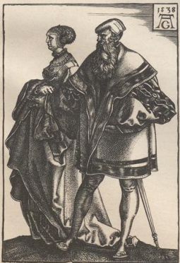
5. Aus dem großen Hochzeitstage von 1538. Kupferlich von Heinr. Aldegrever.