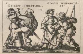
10. Tanzende Bauern. (Die Monac.) Kupferlich von S. Beham.