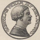
6. Medaille mit dem Bildnis des Bartel Beham, geb. in Nürnberg 1502, † in Italien um 1540.