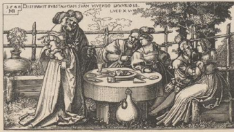
8. Das Gastmahl des Verchwenders. Kupferlich von Seb. Beham.