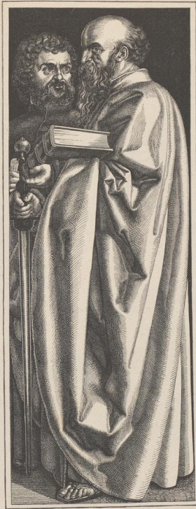
2. Die Apostel Paulus und Marcus. Von Dürer. Pinakothek in München.