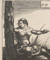
9. Lucretia. Kupferlich von S. Beham.