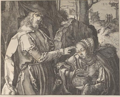
4. Christus mit Magdalena. Kupferlich von Lucas von Leyden.