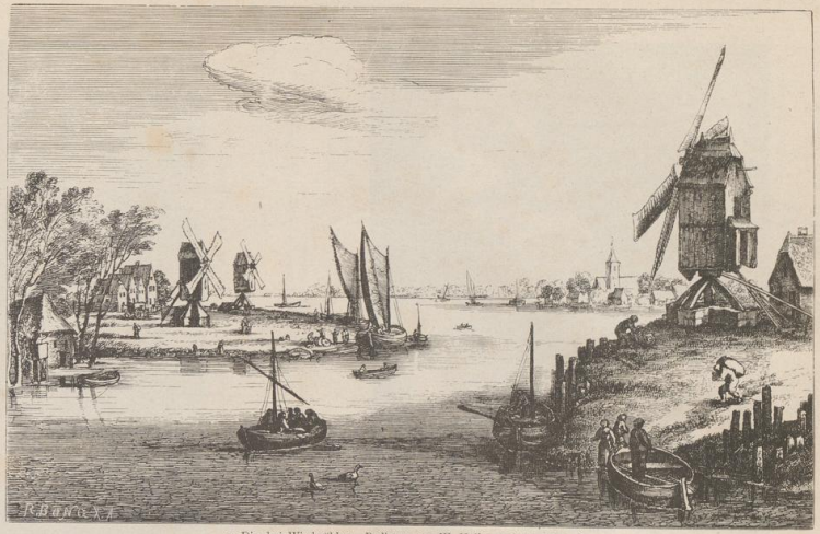
3. Die drei Windmühlen. Radirung von W. Hollar nach Jan Bruegel.