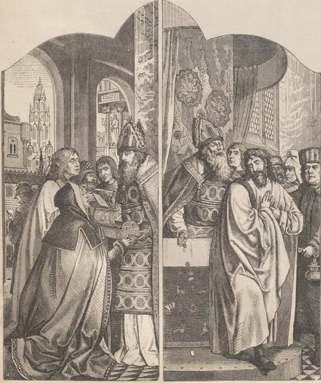
1. Außere Flügelbilder von dem Altar in der Peterskirche zu Löwen. Von Quenin Mafys (geb. zu Löwen 1466, † in Amsterdam 1530).