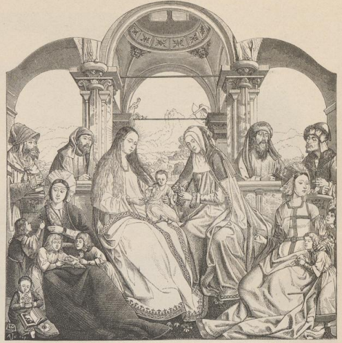
2. Mittelbild des Flügelaltars in der Peterskirche zu Löwen. Von Q. Mafys.