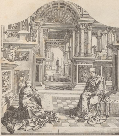
2. Aharbild im Dom zu Prag. Von Jan Gossaert von Mabuse (geb. um 1470 in Maubeuge).