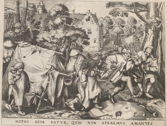
5. Composition von Peter Bruegel (Bauernbruegel). Nach dem Kupferstiche des Petrus a Merica. MOPSO NISA DATVR, QVID NON SPEREMVS AMANTES.

Druck von Metzger & Wittig in Leipzig. — 3. Abdruck 1880.