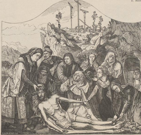
3. Die Grablegung Christi. Von Q. Mafys. Museum zu Antwerpen. Druck von Metzger & Wittig in Leipzig. — 3. Abdruck 1880.