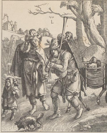
6. Der Eulenspiegel. Kupferlich von Lucas von Leyden.