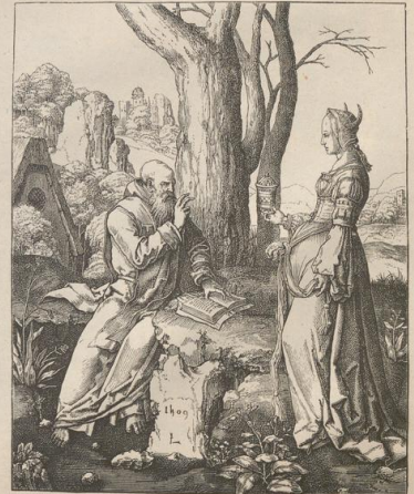
5. Der h. Antonius. Kupferlich von Lucas von Leyden (1494—1533).