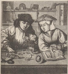
1. Der Geldwechsler und seine Frau. Von Quentin Matsys. Louvre.