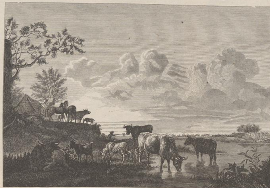
6. Sonnenaufgang. Von Adriaan van de Velde. (1639—1672.)