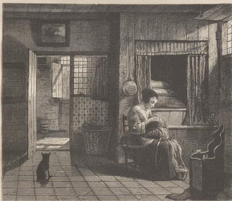
4. Morgentollette. Von Pieter de Hooch (c. 1632—1681). Museum van der Hoop in Amsterdam.