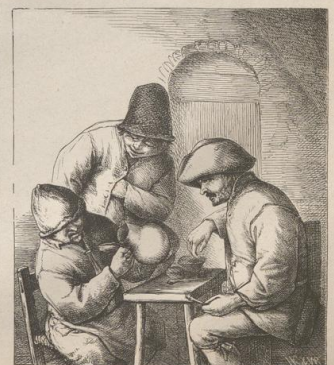
1. Der leere Krug. Nach einer Radirung von A. von Ostade.

Druck von Metzger & Wittig in Leipzig. — 3. Abdruck 1880.