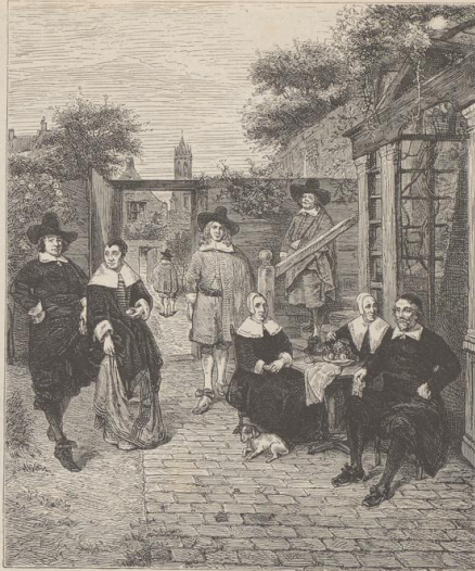
3. Holländisches Familienbild. Von Jan van der Meer von Delft (geb. um 1635; gest. um 1696). Akademische Galerie in Wien.