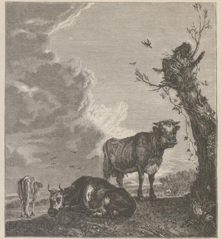
5. Der brüllende Stier. Von P. Potter. Buckingham-Palace.