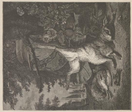
6. Toches Wild. Von Jan Weenix (geb. um 1640, † 1719). Belvedere in Wien.