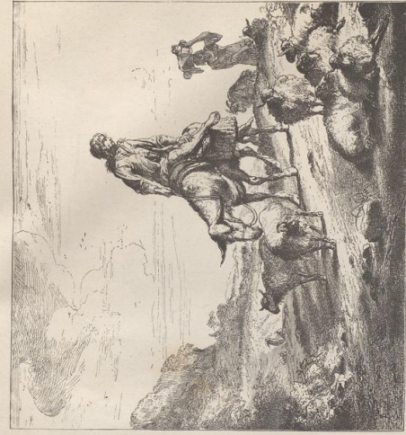
4. Der Mann auf dem Esel. Gemälde von Claes Pietersz Berchem (1626—1683). Dresdener Galerie.