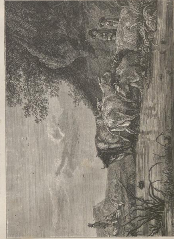
1. Kühe an einem Teiche. Von A. Cuyt (1657—1691). Galerie W. Wella, Reichenpark.