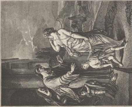
5. Verhohlung der Hagar. Von Adriaen van der Werff (1659—1712). Dresdener Galerie.