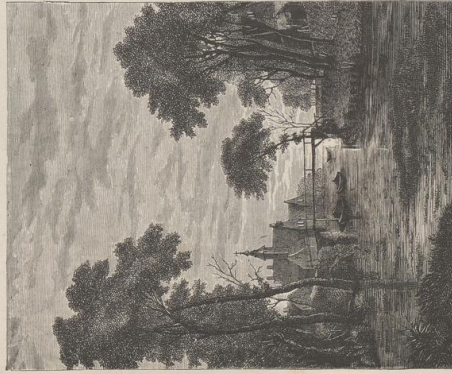
3. Landschaft von Aart van der Neer. (Geb. vor 1620, † nach 1691). Fingirt, Leichensteinische Galerie in Wien.