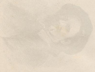
Portrait of a woman, facing right.