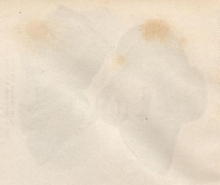
Portrait of a woman, facing right.