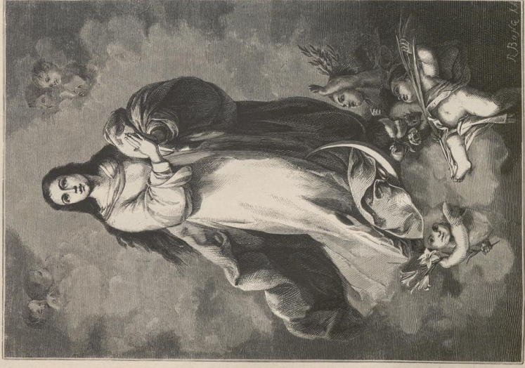
4. Conception. Von Murillo. Museo del Prado zu Madrid.