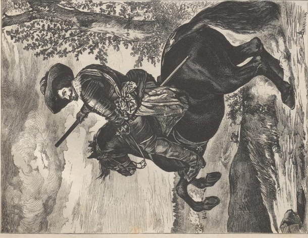
1. Herzog Olivarez. Von Velazquez. Museo del Prado zu Madrid.