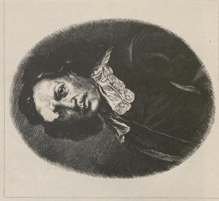
5. Bartholome Eichen Murillo (1617-1682).

Druck von Metzger & Witt in Leipzig. — 3. — 4. — 5. — 6. — 7. — 8. — 9. — 10. — 11. — 12. — 13. — 14. — 15. — 16. — 17. — 18. — 19. — 20. — 21. — 22. — 23. — 24. — 25. — 26. — 27. — 28. — 29. — 30. — 31. — 32. — 33. — 34. — 35. — 36. — 37. — 38. — 39. — 40. — 41. — 42. — 43. — 44. — 45. — 46. — 47. — 48. — 49. — 50. — 51. — 52. — 53. — 54. — 55. — 56. — 57. — 58. — 59. — 60. — 61. — 62. — 63. — 64. — 65. — 66. — 67. — 68. — 69. — 70. — 71. — 72. — 73. — 74. — 75. — 76. — 77. — 78. — 79. — 80. — 81. — 82. — 83. — 84. — 85. — 86. — 87. — 88. — 89. — 90. — 91. — 92. — 93. — 94. — 95. — 96. — 97. — 98. — 99. — 100.