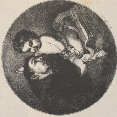
3. Das Christkind erhebt dem h. Antonius. Von Murillo. Museum in Sevilla.