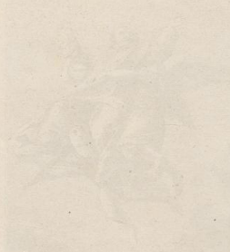
Engraving of a person in a landscape.