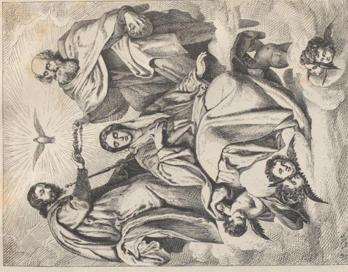
2. Königung Maria. Von Velazquez. Museo del Prado in Madrid.