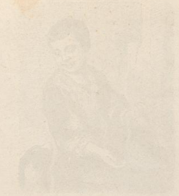
Engraving of a seated person.