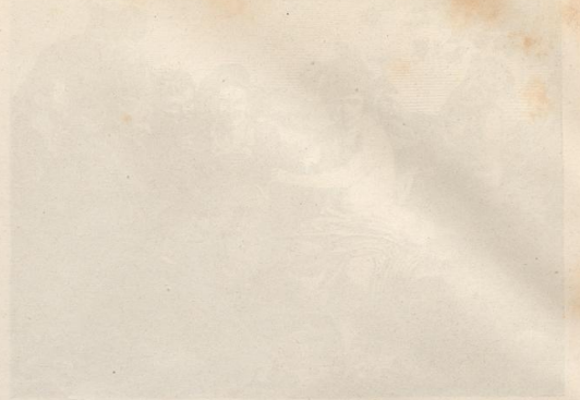
Engraving of a landscape with a large tree.