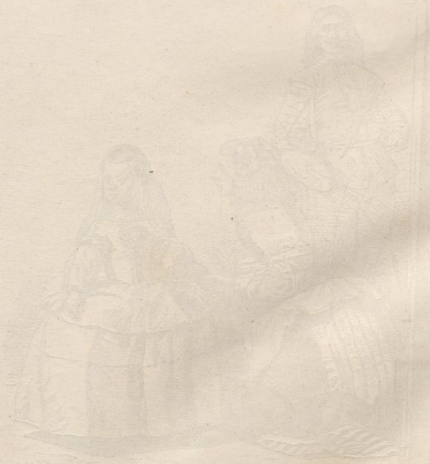
Engraving of a person in a landscape.