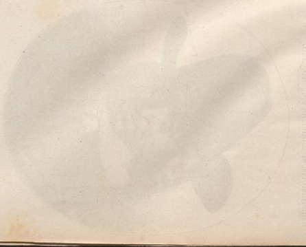
Portrait of a woman, facing right.