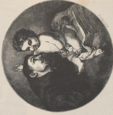
3. Das Christkind erhebt dem h. Antonius. Von Murillo. Museum in Sevilla.