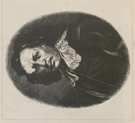
5. Bartolomé Estéban Murillo (1617-1682).