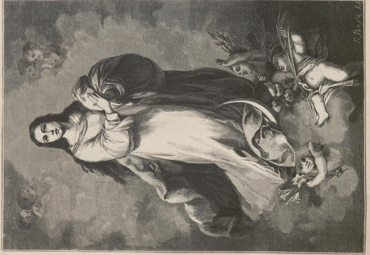
4. Conception. Von Murillo. Museo del Prado zu Madrid.