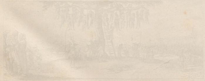
Engraving of a large outdoor scene with many people and animals.