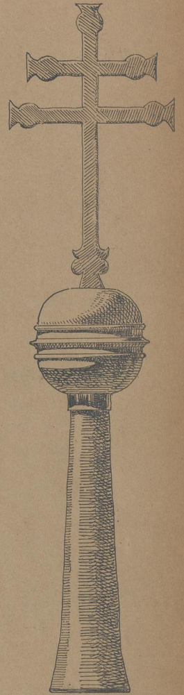
IM MASSTAB DER THÜRE. DACHSPITZE IN KUPFER MIT KREUZ AUS FLACHEISEN.