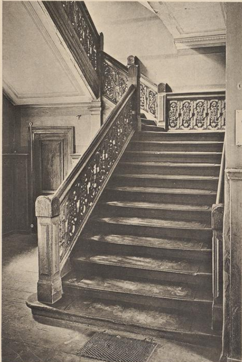
Brüderstraße 13 (siehe Tafel 43)