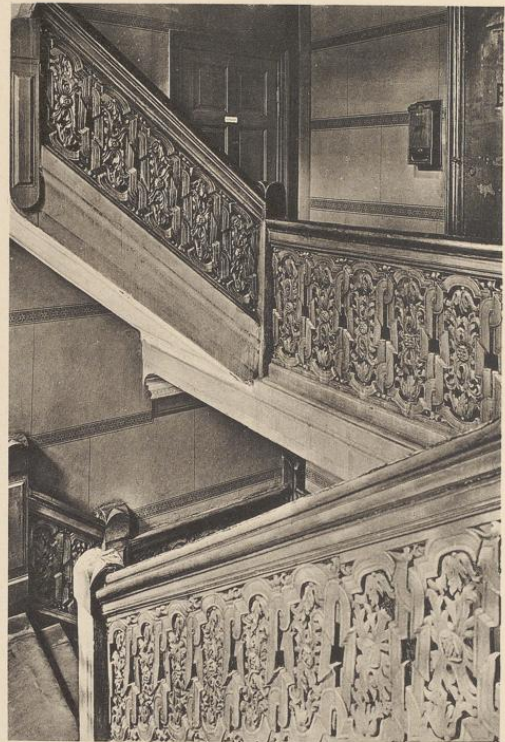
Brüderstraße 13 (siehe Tafel 43)