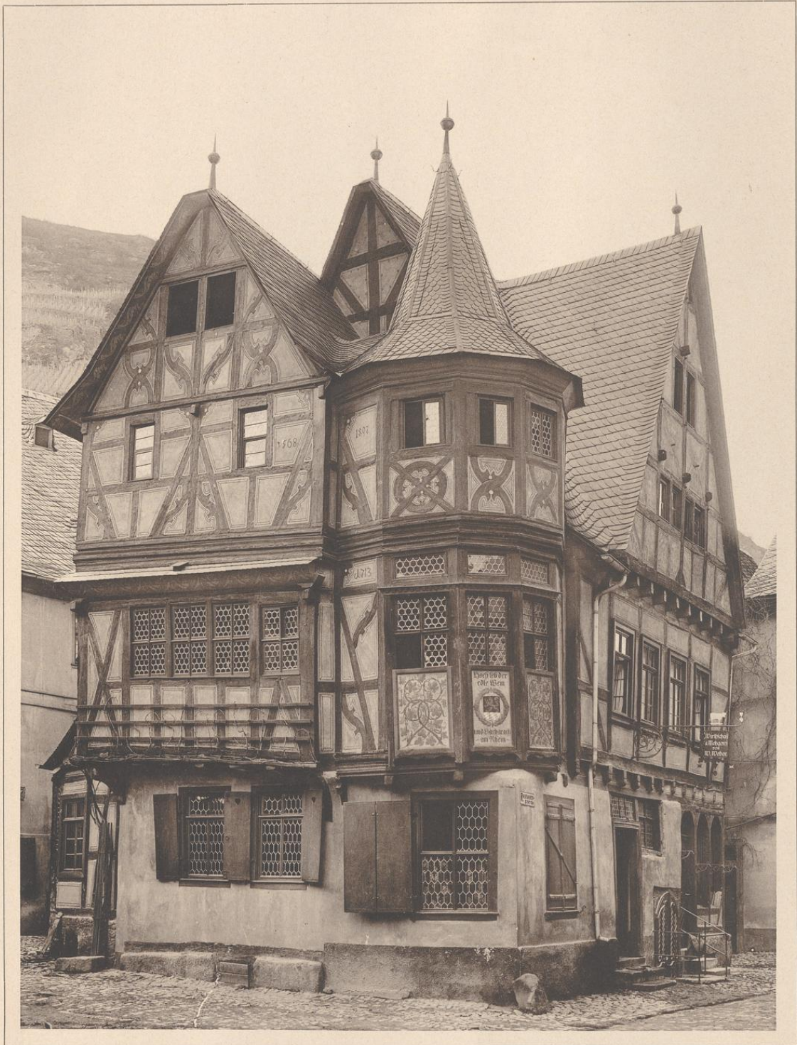
HAUS IN BACHARACH A. RH. DIE ÄLTEREN THEILE VON 1568.