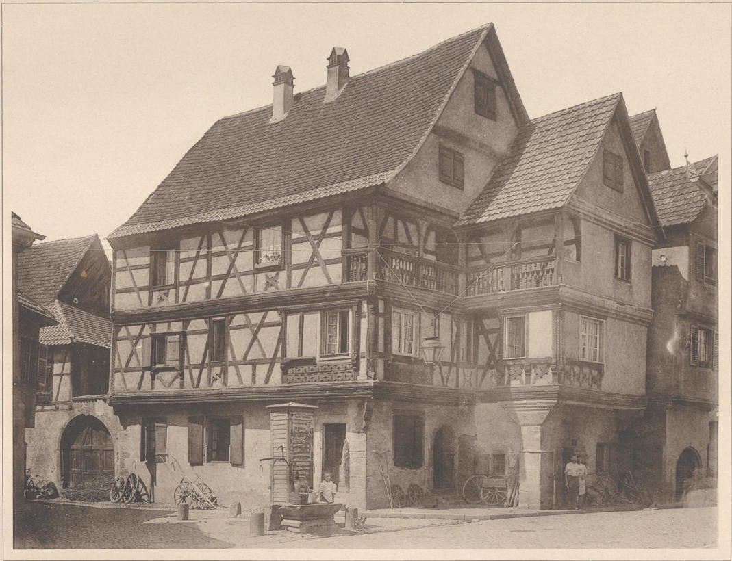
HAUS ZU KAYSERSBERG I. E. 1594.