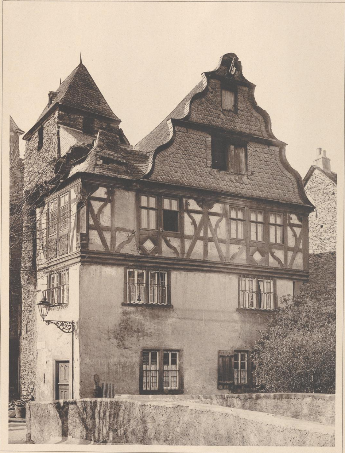
HAUS IN COCHEM A. D. MOSEL. 17. JAHRHUNDERT.