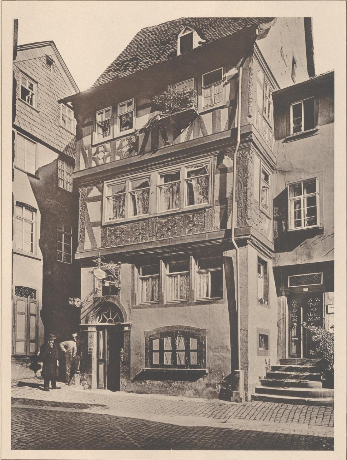
HAUS IN MILTENBERG A. M. 1623.