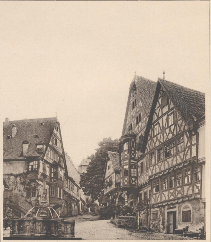
MARKTPLATZ UND STRASSE IN MILTENBERG A. M.