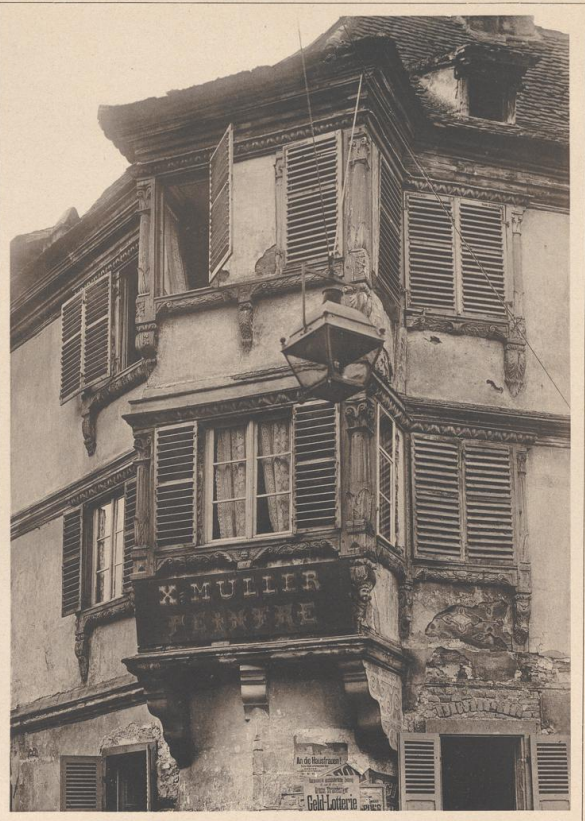
HAUS IN MOLSHEIM IM ELSASS. 17. JAHRHUNDERT.