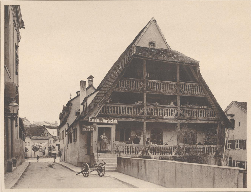
HAUS IN EICHSTÄTT (MITTELFRANKEN). 18. JAHRHUNDERT.