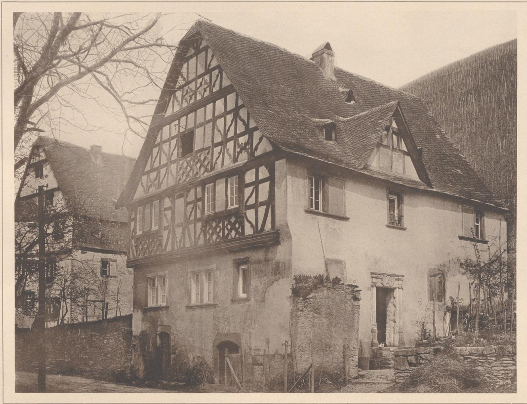
HAUS IN RISSBACH A. D. MOSEL. 1625.