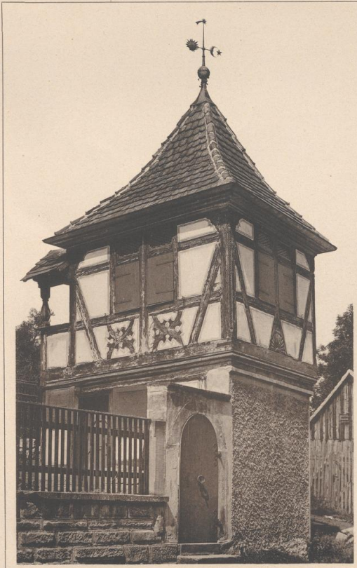
GARTENHAUS IN SCHWÄBISCH-HALL (VOR DEM WEILER THOR). 16.—17. JAHRHUNDERT.