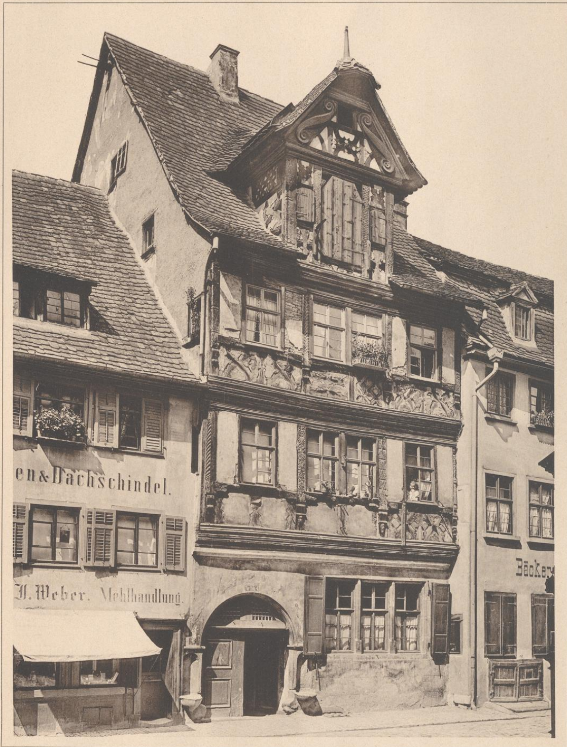
HAUS IN SCHWÄBISCH-HALL (GELBINGERSTRASSE). 1605.