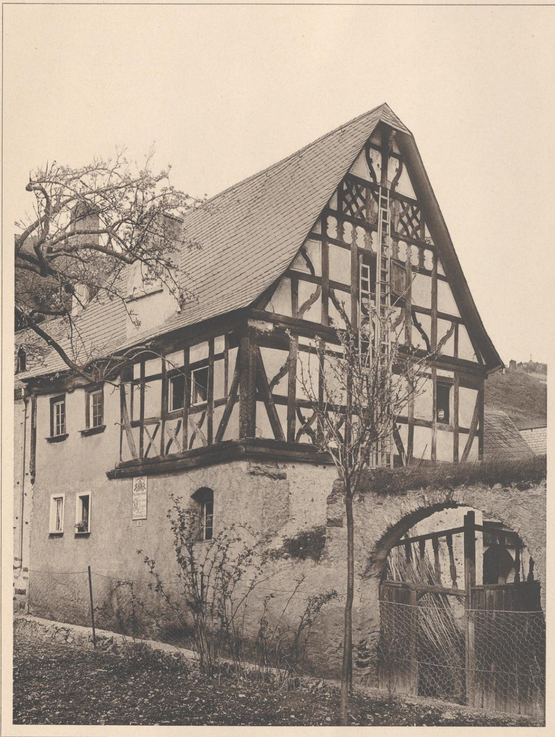
HAUS IN COBERN A. D. MOSEL. 1577.