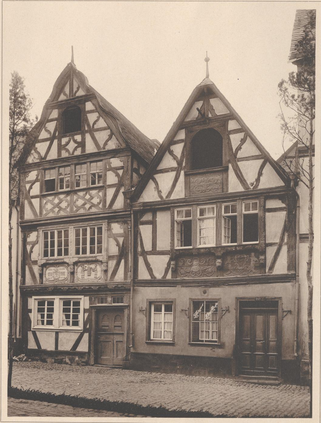
ZWEI HÄUSER IN RHENSE A. RH. 1671 UND 1652.