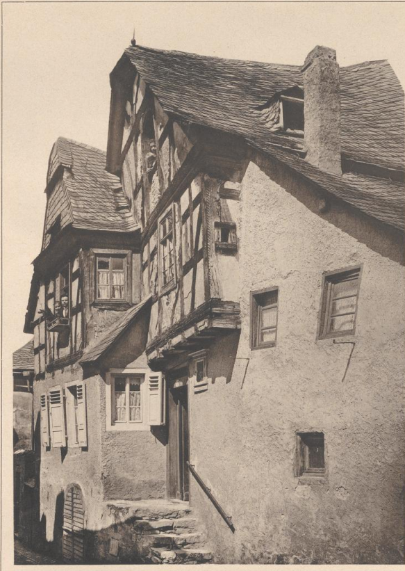
HAUS IN ASSMANNSHAUSEN A. RH. 17. JAHRHUNDERT.