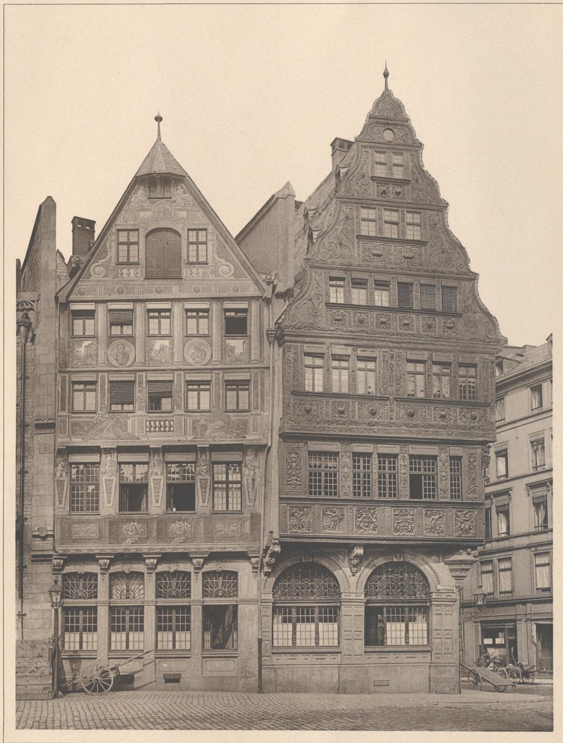
DAS SALZHAUS IN FRANKFURT A. M. ANFANG DES 17. JAHRHUNDERTS.