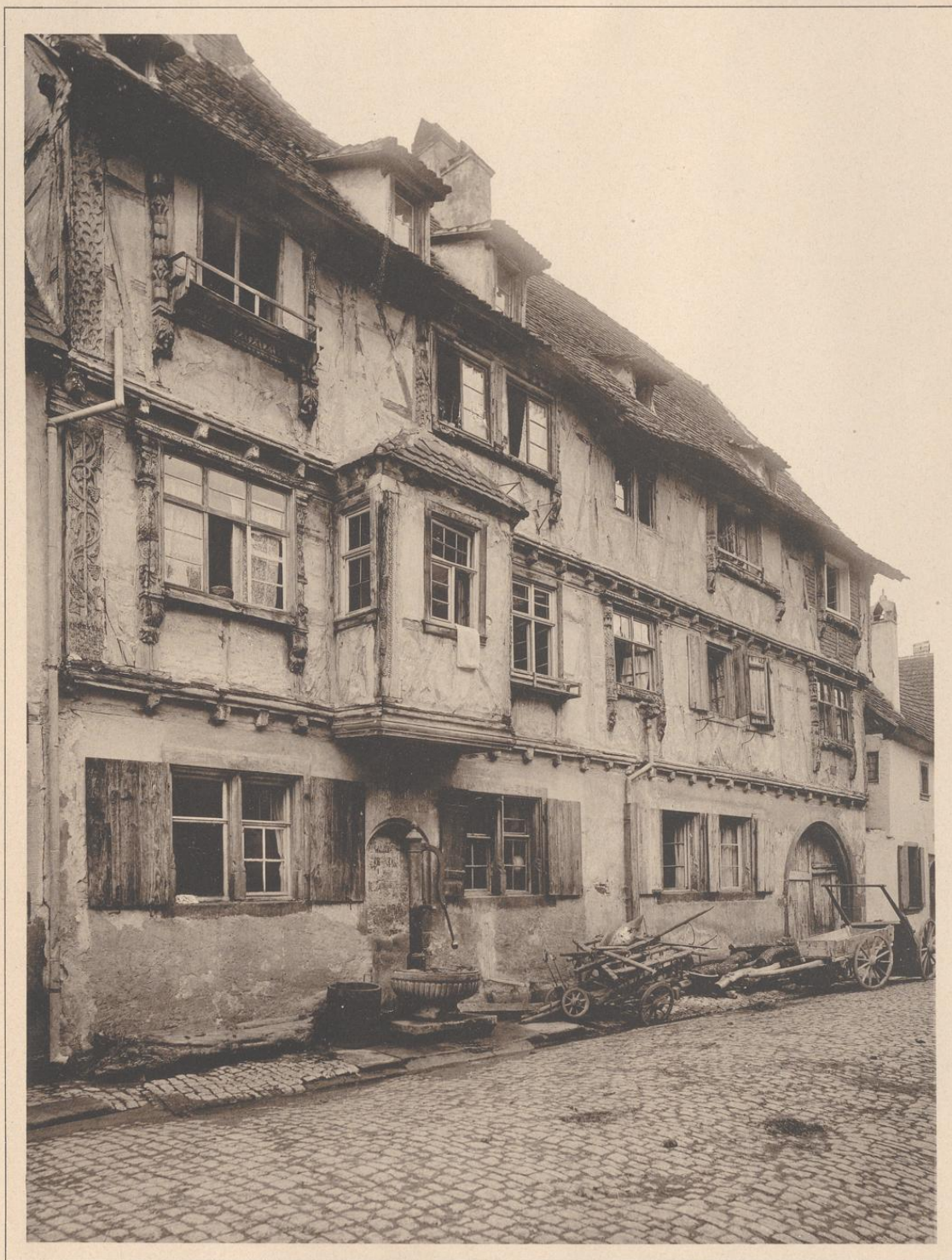
HAUS ZU WEISSENBURG I. E. (WOLLGASSE.) 16.—17. JAHRHUNDERT.