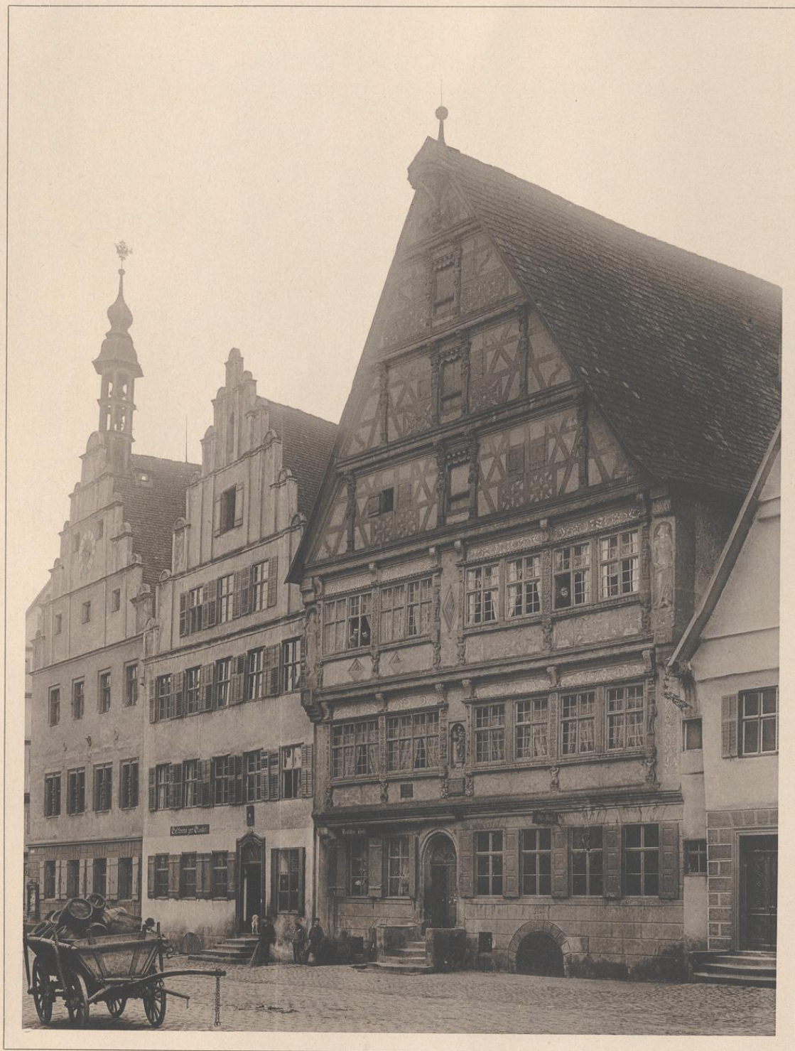
DAS „DEUTSCHE HAUS“ IN DINKELSBÜHL. 1543.