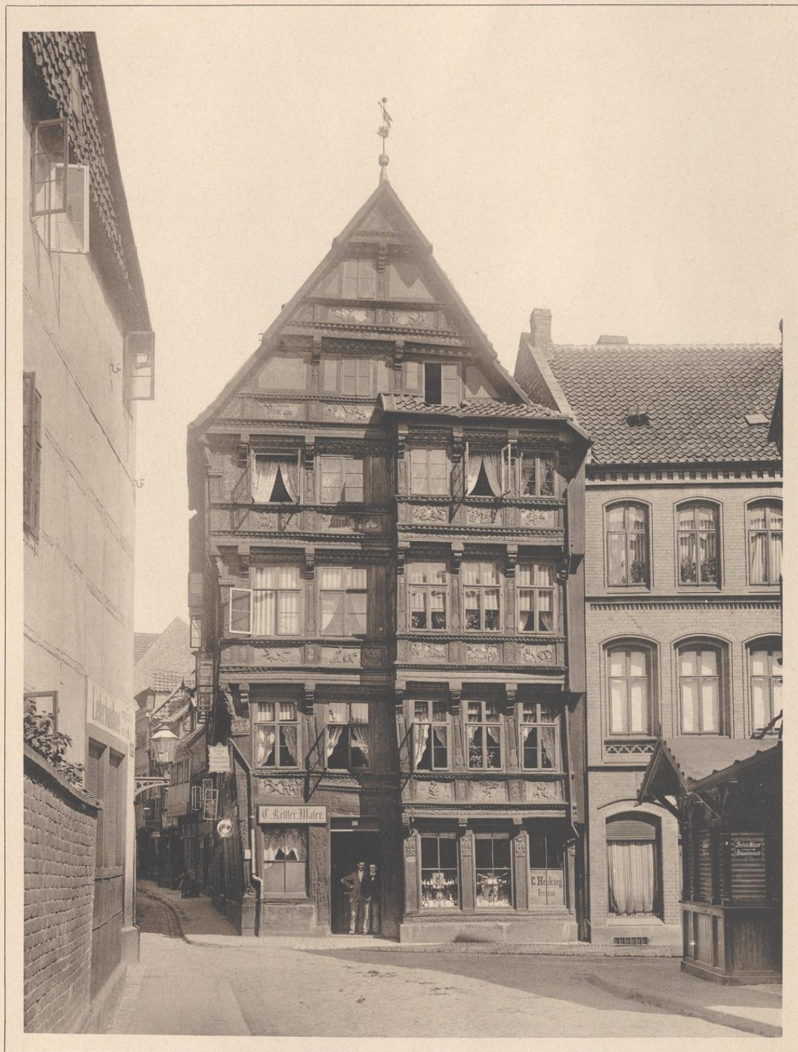
DAS ROLANDSTIFT ZU HILDESHEIM. 1611.