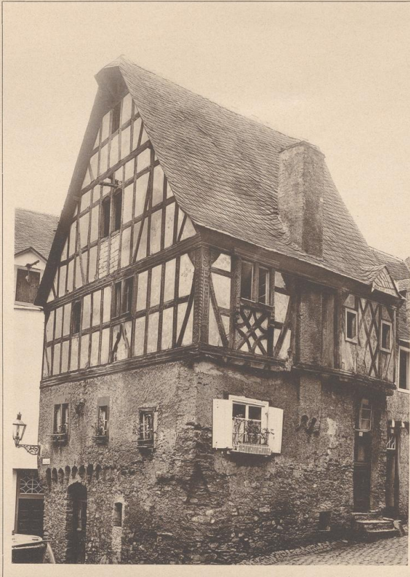
HAUS IN EDIGER A. D. MOSEL. 17. JAHRHUNDERT.