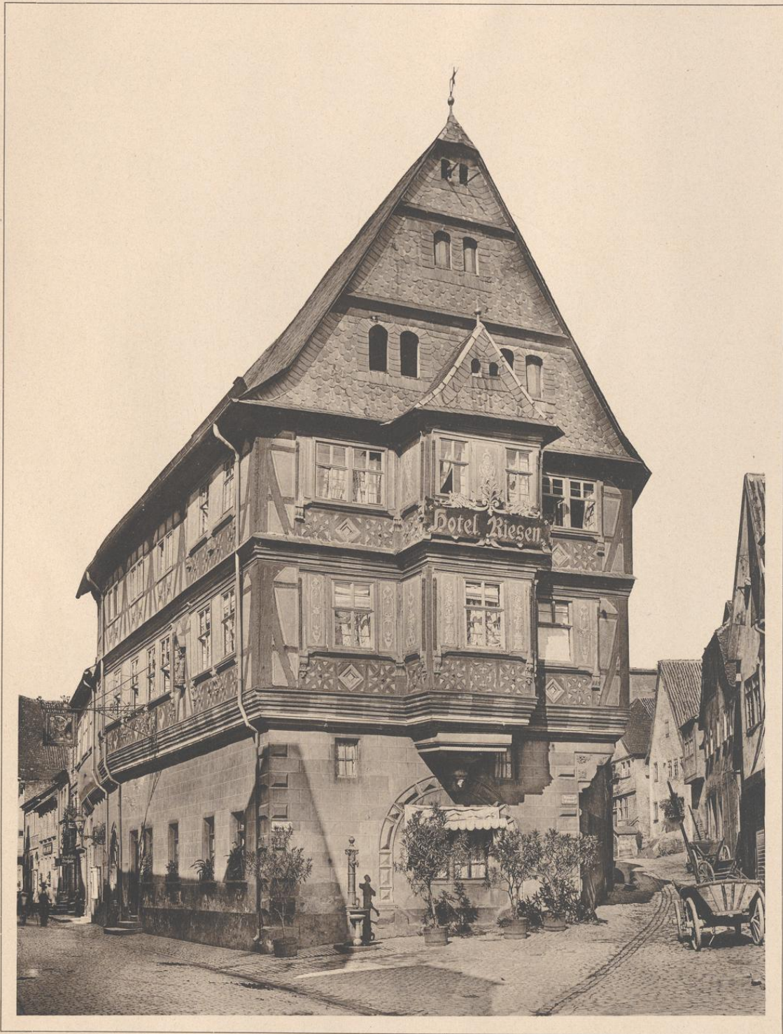
GASTHAUS ZUM RIESEN IN MILTENBERG A. M. 16.—17. JAHRHUNDERT.