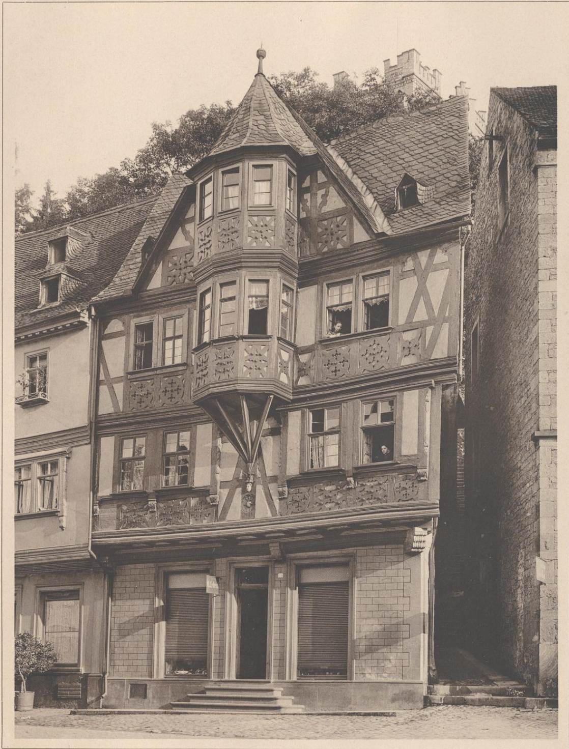
HAUS IN MILTENBERG A. M. 1623.