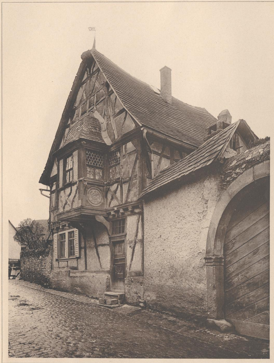
HAUS IN KIEDRICH BEI WIESBADEN. 1672.