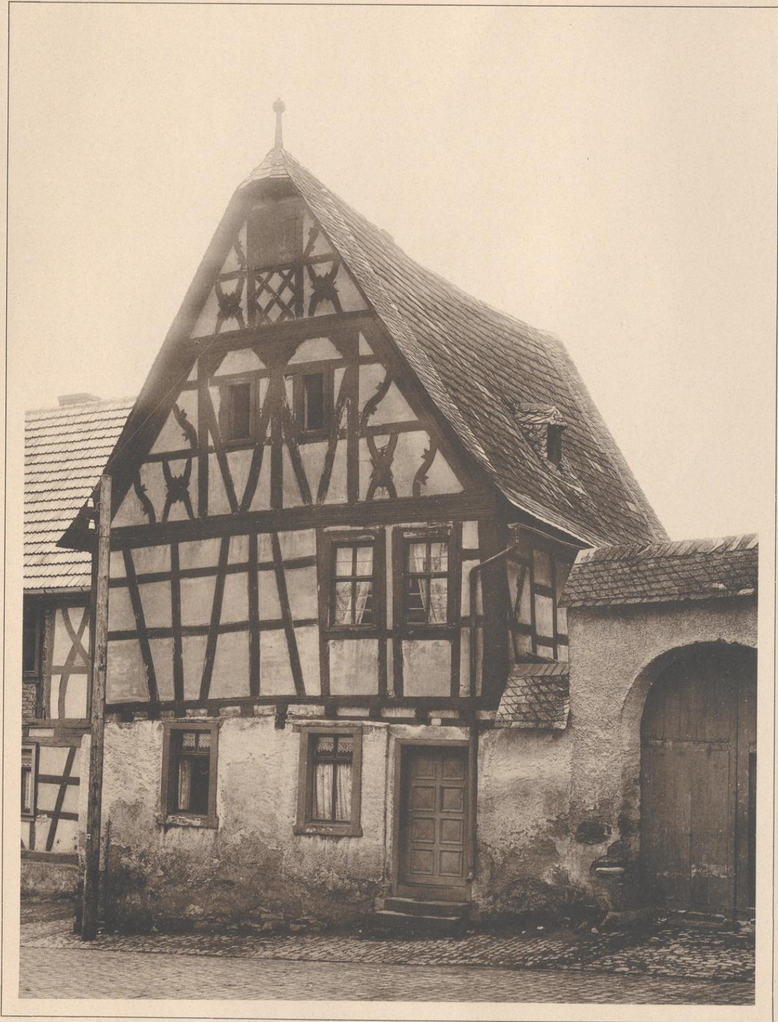
HAUS IN KIEDRICH BEI WIESBADEN. 17.—18. JAHRHUNDERT.