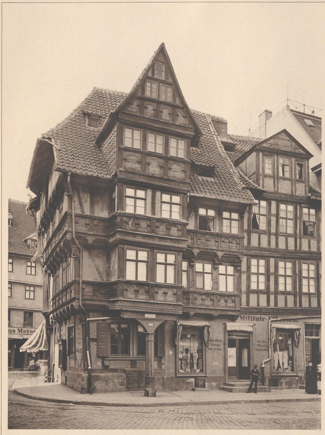
HOLZMARKT Nr. 8 IN HALBERSTADT. 1576.