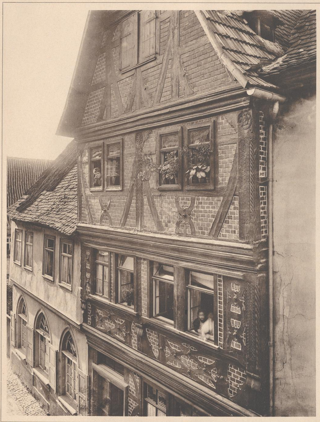
HAUS IN MILTENBERG A. M. 17.—18. JAHRHUNDERT.