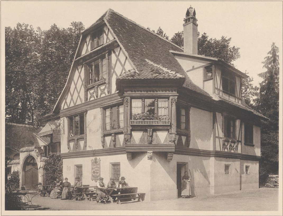
HAUS IN STRASSBURG I. E., FRÜHER IN MOLSHEIM. 17. JAHRHUNDERT.