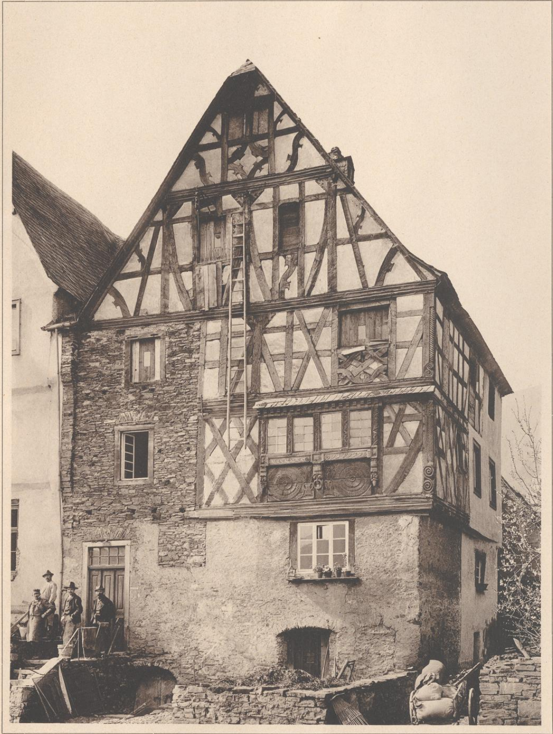
HAUS IN BREMM A. D. MOSEL (MOSELSTR.) 1619.