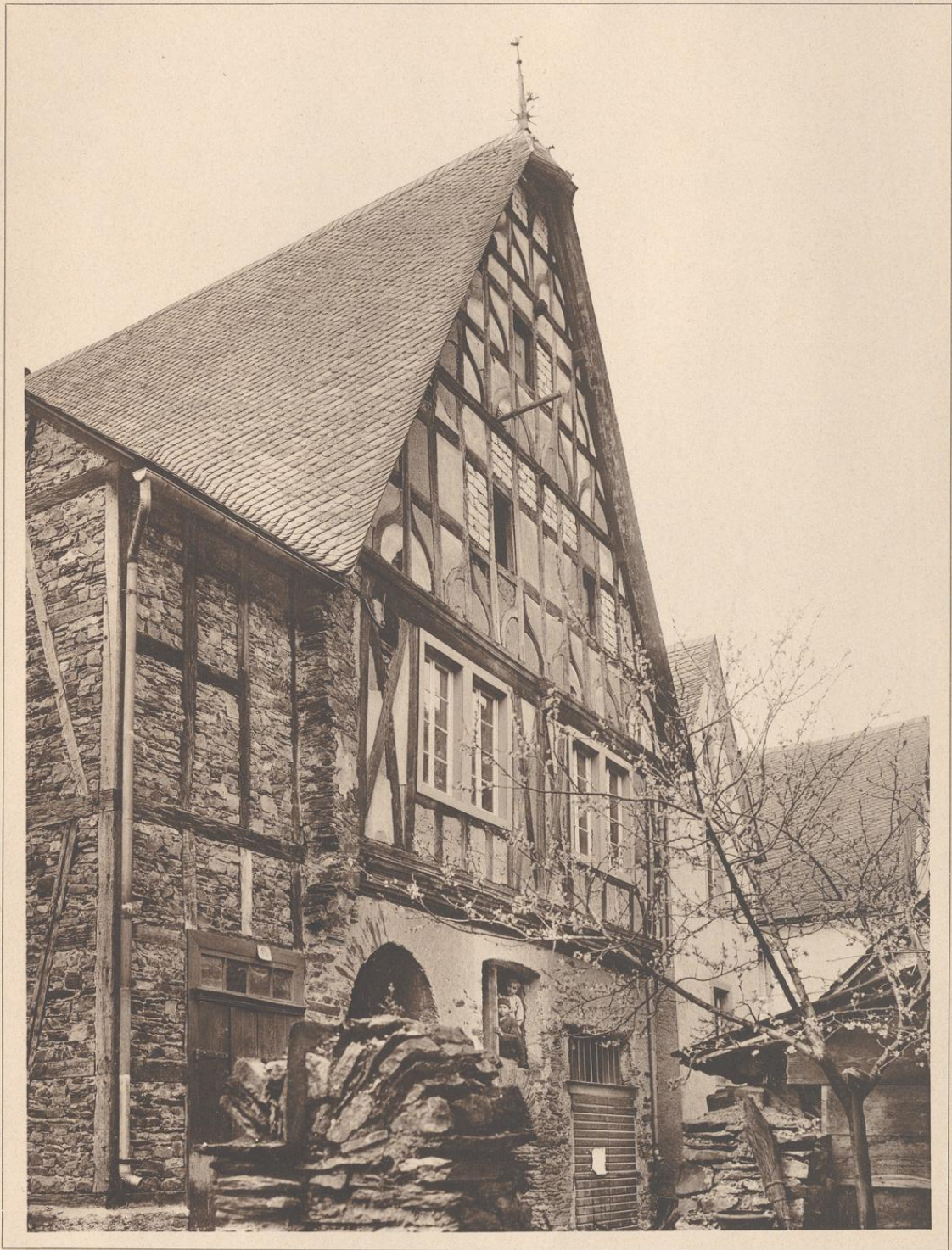
HAUS IN ELLENZ A. D. MOSEL. 17.—18. JAHRHUNDERT.