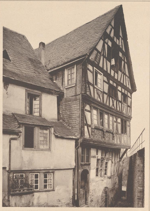
HAUS IN RHENSE A. RH. 1629.