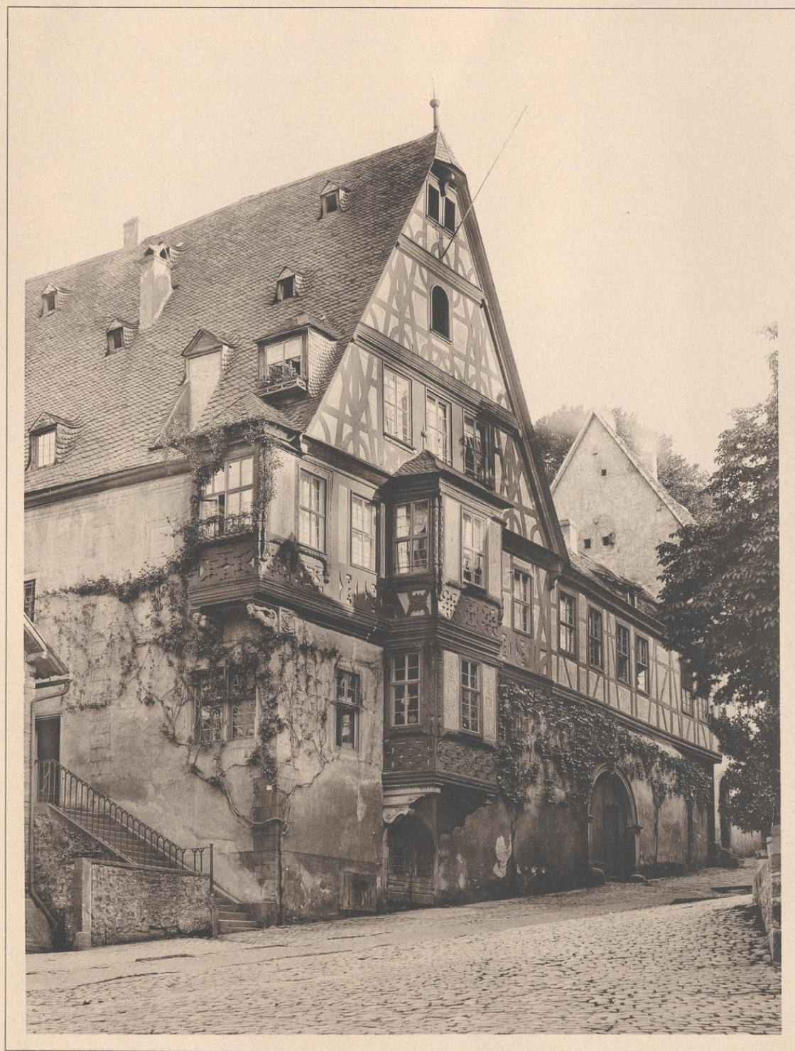
HAUS IN MILTENBERG A. M. 17. JAHRHUNDERT.