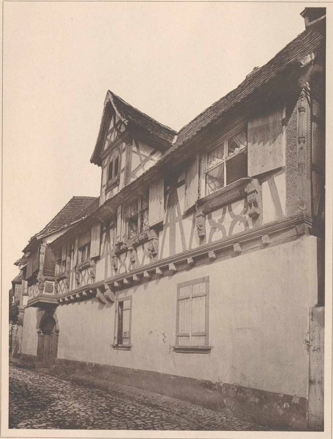
HAUS ZU WEISSENBURG I. E. (JOHANNESGASSE.) 1599.