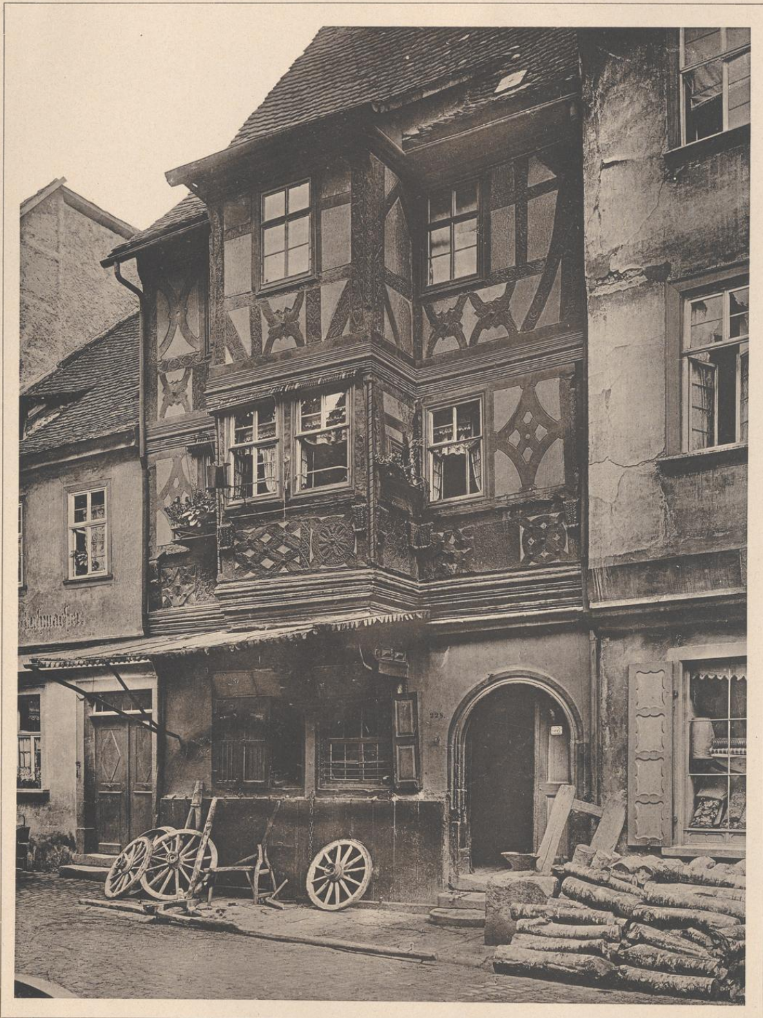
HAUS IN MILTENBERG A. M. 17. JAHRHUNDERT.