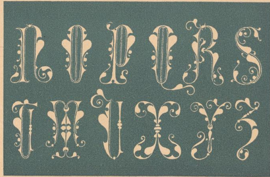
HRACHOWINA: INSTIALES, ALPHABETE ETC.