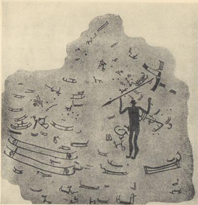
1. Felsbild von Litsleby, Tanum. Nach O. Almgren.