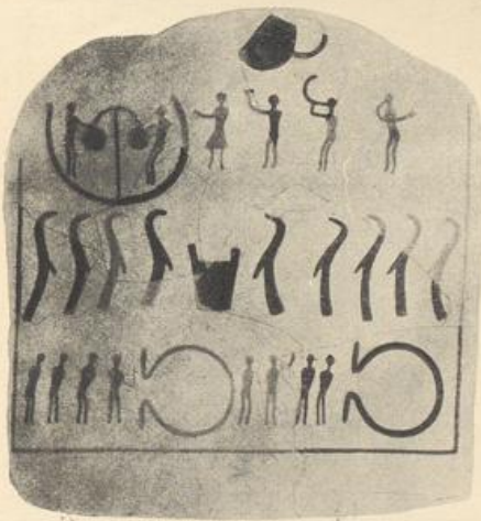
2. Kivifstein 8. Kulthandlung Nach O. Almgren.