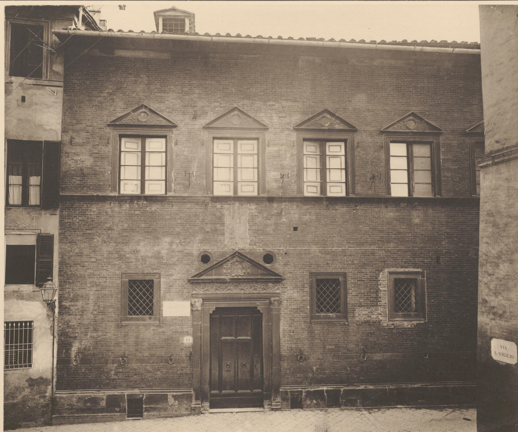
Phot. Paolo Lombardi. Siena.