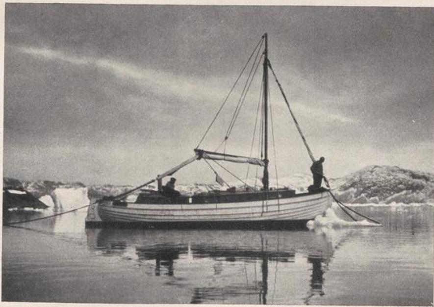
Die „Krabbe“ vor Anker und Trosse