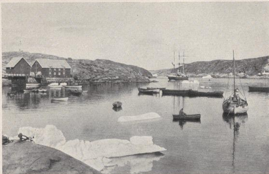
Hafen von Jakobshavn; rechts die „Krabbe“ und der „Mojes“