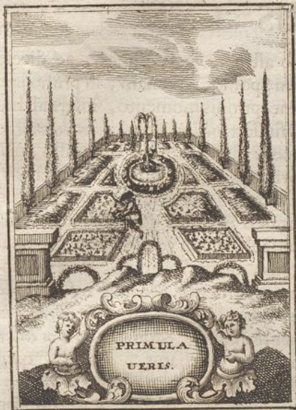
Primula, Veris honos, redivivæ prodroma Floræ, Primitias vario picta colore tenet. Præcedit reliquos homines Sacra Primula Veris Numinis alma Parens, crimine prima carens.

In omni populo, & in omni gente, primatum ha- bui. Eccli. c. 24. v. 10.