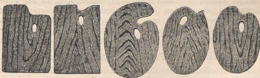
Fig. 59. Paletten für Ölfarben.

Die Paletten für Ölfarben, deren Gebrauch und Handhabung vorausgesetzt werden kann, sind rund oder viereckig, aus Birnbaum, Nufsholz, Ahorn oder Mahagoni und in den Gröfsen von