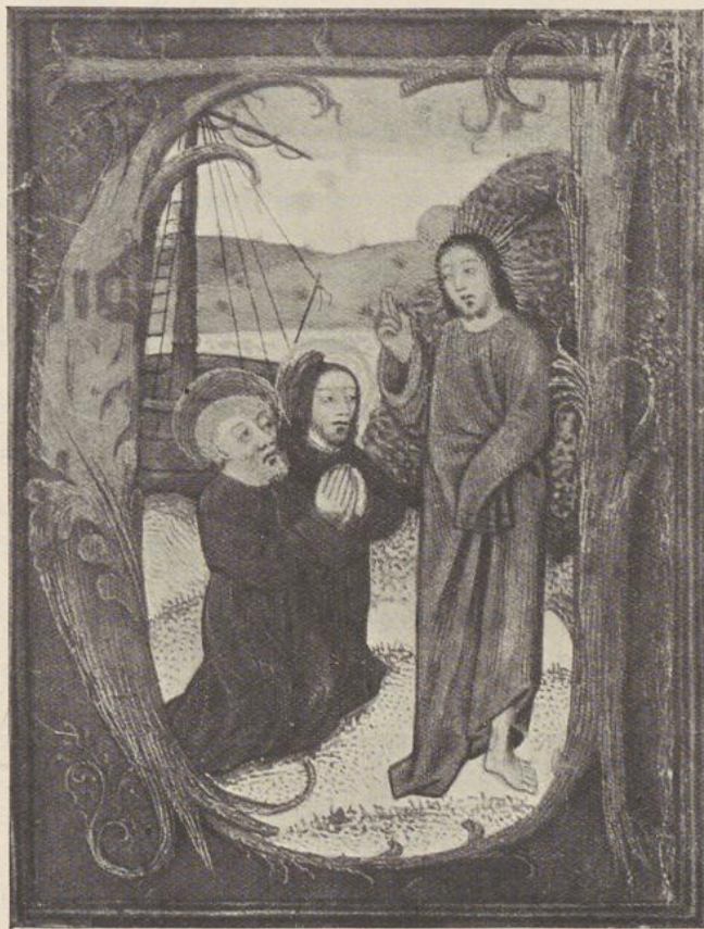
57. DE ROEPING VAN PETRUS EN ANDREAS

Vermaagschapt met de Gentsch-Brugsche school. Begin der XVI e eeuw.