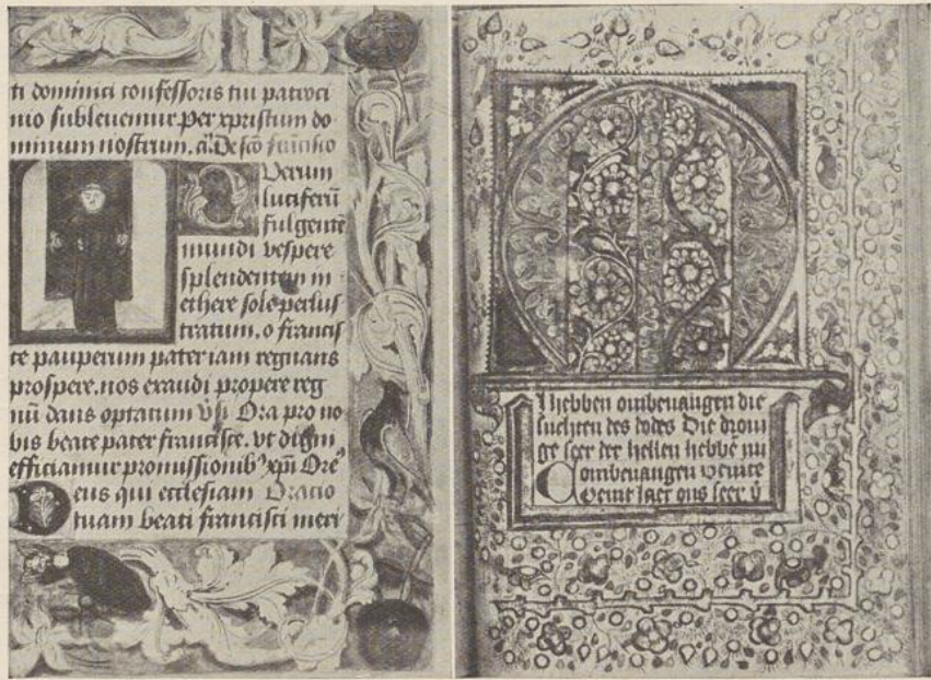
54. 1. S. FRANCISCUS (u. VIII)

Einde XV e eeuw. 278 bladzijden (1), perkament, groot in-folio — 550 × 400 mm. Hs. — U. XX —