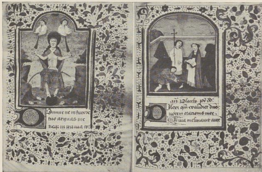
53. 1. LAATSTE OORDEEL (u. III)

Dit boek bevat 7 miniaturen met randversieringen. Verder werden talrijke gekleurde aanvangsletters in goud en kleur in den tekst aangebracht, evenals een twintigtal grotesken.