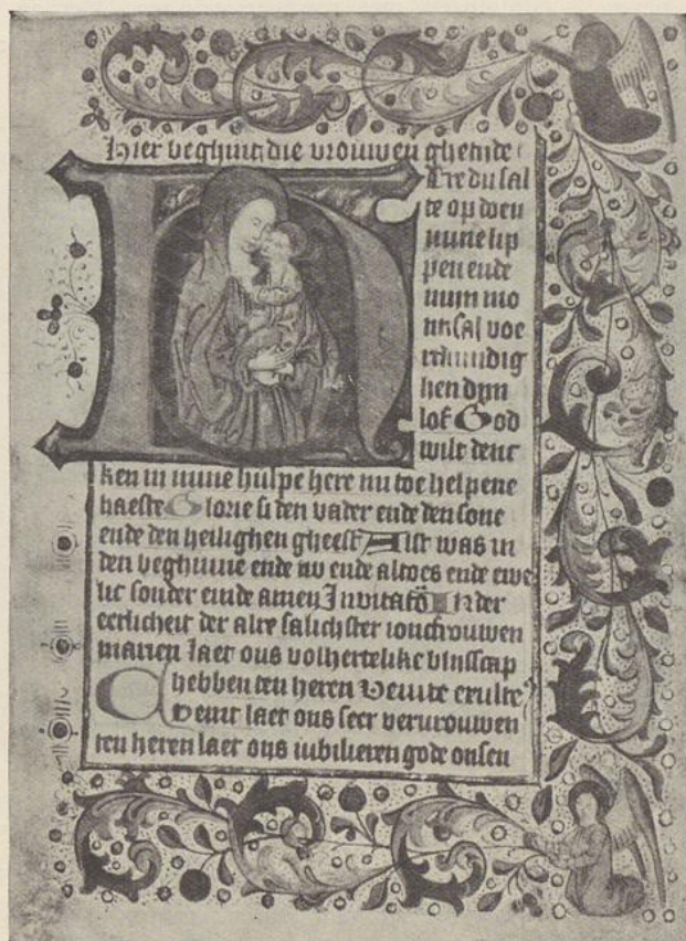
52. DE MAAGD MET HET KINDJE JESUS (u.V)

De vier laatste beginletters zijn in den zelfden trant verlucht als die op bladzijde 61.