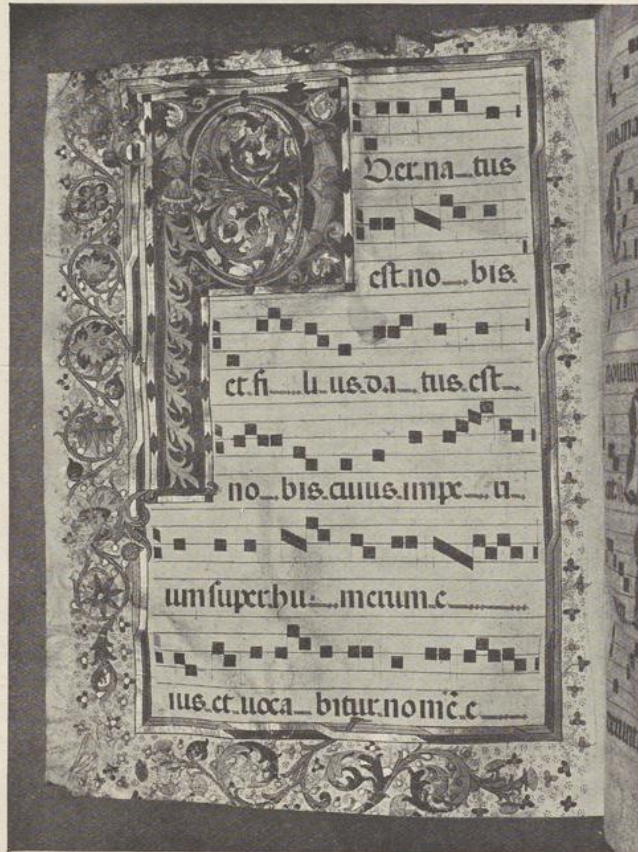
55. GRADUAAL (u. XX)

Omlijsting : (60 mm. breed) zelfde versiering.