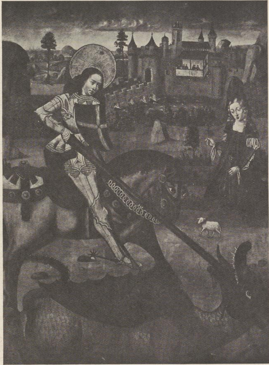
58. ST JORIS XV e EEUW